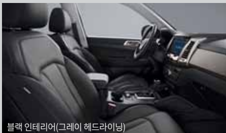
블랙 인테리어(그레이 헤드라잉)