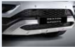
스키드 플레이트 세트(전/후) 320,000