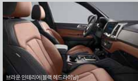
브라운 인테리어(블랙 헤드라잉)