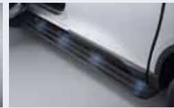
고정식 사이드 스텝 350,000