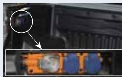
PTO 발전기 패키지(발전용량 : 5.5kVA, 출력:220V) 2,990,000