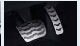
스포츠 페달 30,000