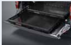
슬라이딩 베드 400,000