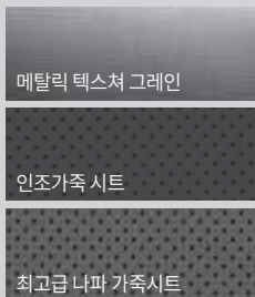
메탈릭 텍스처 그레인