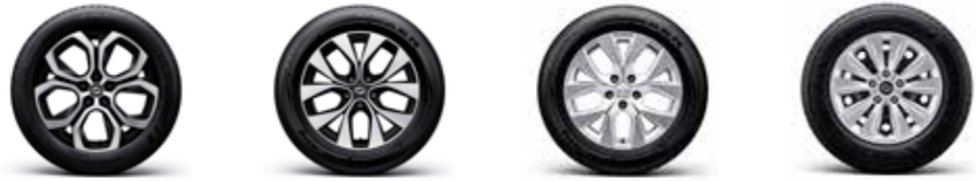
18" 블랙 투톤 알루미늄 휠 17" 블랙 투톤 알루미늄 휠 17" 알루미늄 휠 16" 스틸 휠