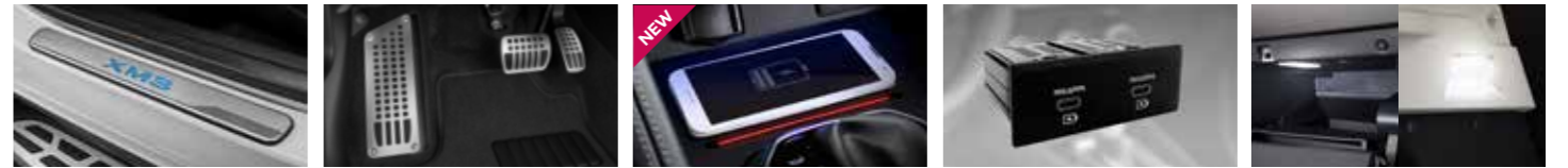
일루미네이팅 키링플레이트 160,000원 프리미엄 스포츠 페달 60,000원 일체형 무선 충전기 (15W) 140,000원 뒷좌석 전용 초고속급속 충전기 80,000원 LED 램프세트 49,000원

프론트(운전석, 조수석) 2개, 조정가능 풋라스트, 액셀, 브레이크 페달 세트 ※ 무선 충전기 지원 기종 및 사용 주의사항은 르노코리아자동차 액세서리 쇼핑몰에서 확인 가능합니다. • USB PD3.0 2Port C Type, QC4+ / AFC 등 PPS를 지원하는 스마트 기기들을 고속 충전 ※ 뒷좌석 초고속 급속 충전기는 RESIG 트림 이상부터 구매 가능합니다. 중앙등, 화장등, 글로브 박스, 트렁크 등 ※ 모델별 장착범위 상이