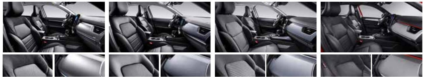
블랙 가죽시트 (RE, RE Signature 선택) 모던 액세서리팩 (RE, RE Signature 기본) 블랙 인조가죽시트 (LE, RE, RE Signature 기본) 핵사곤 데코 (SE, LE 기본) 블랙 직물시트 (SE 기본) 핵사곤 데코 (SE, LE 기본) 블랙 가죽시트 (레드 스티치 포함) 하이데코 핵사곤 & 레드 데코 (INSPIRE 기본)