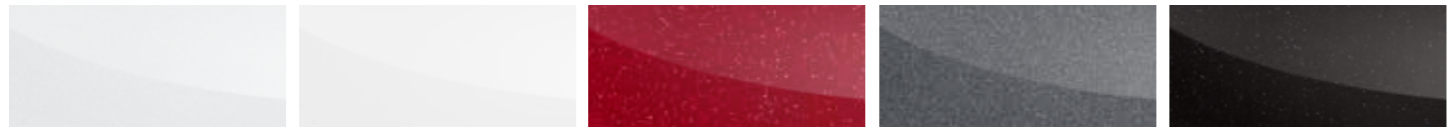
클라우드 펄 Cloud Pearl 솔리드 화이트 Solid White 소닉 레드 Sonic Red 어반 그레이 Urban Grey 메탈릭 블랙 Metallic Black

1.6 GTe SE 트림의 경우 솔리드 화이트, 어반 그레이, 메탈릭 블랙만 선택 가능합니다. TCe260 INSPIRE 트림의 경우 클라우드 펄, 소닉 레드만 선택 가능합니다.