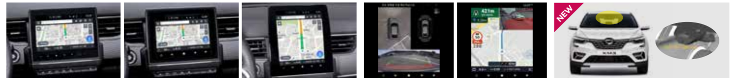
8" 스마트 내비게이션 (후방 카메라 포함) 840,000원 7" 스마트 내비게이션 (후방 카메라 포함) 760,000원 9.3" 스마트 내비게이션 플러스 (H-D 후방 카메라 포함) 1,150,000원 3D-HD 360° 스카이라이프 카메라 EASY CONNECT 7" / 9.3" 전용 1,100,000원 스마트내비 8" / 7" / 9.3" 전용 995,000원 빌트인 캠 890,000원

내장형 맵 T map(테더링 업데이트, 미러링), 음성인식 SKT NUGU 기능 지원, Ez parking (Semi 스카이라이프 기능) ※ XM3 1.6GTe RE, TCe260 RE는 적용불가 ※ 스마트 내비게이션은 시그니처 패키지와 중복 불가합니다. ※ 9.3" 화면은 스마트 내비게이션 기능(T map, Pop Media)에 한해서 지원되며, 이외의 모든 차량 디스플레이 오디오 화면은 7" 화면으로 제공됩니다. 8" 스마트 내비게이션과 동일기능 및 Melon, 유튜브, 팟캐스트, 뉴스리더, 오디오북 지원 ※ XM3 1.6GTe SE, LE는 적용불가 내장형 맵 T map(테더링 업데이트), 음성인식 SKT NUGU 기능 지원, Melon, YouTube, 팟캐스트, 뉴스리더, 오디오북 지원, Ez parking (Semi 스카이라이프 기능) 3D-HD 360° 스카이라이프 카메라 ※ 7" 스마트내비에서는 Full mode 지원이 되지 않습니다. ※ 3D-HD 360° 스카이라이프 카메라 선택 시, 후방 카메라는 AVM 전용 HD 후방 카메라로 변경되어 액세서리 보증기간이 적용됩니다. ※ 3D-HD 360° 스카이라이프 카메라의 보증기간은 2년 (주행거리 4만 Km/yr 이하) 이나됩니다. NEW 3D-HD 360° 스카이라이프 카메라 ※ 차로 변경시, 운전자의 방향지시등 조작과 연동하여 후측방 사각지대 영상을 보여줍니다. ※ 저속 20Km/h 이상에서는 안전 모드부가 출력됩니다. 전방 F-HD/후방 HD Camera를 통해 촬영된 고화질의 영상을 차량 내 Infotainment와 연동하여 편리하게 저장 및 재생할 수 있습니다. • 빌트인 타입으로 설치되어 깔끔하고 안전한 내부 인테리어 유지 가능. • 내장메모리 eMMC, 100GB (CF, SD 카드, 32GB) (기본 블랙박스 대비 안전한 데이터 저장 방식과 타사 대비 3배 이상 높은 저장 용량) ※ 적용차종: RE Basic 이상 선택 가능. 3D-HD 360 Sky View Camera, 전방카메라와 중복 장착 불가 ※ 빌트인 캠의 보증기간은 2년(주행거리 4만km)입니다. ※ 추가 녹화는 보조배터리가 추가로 장착되었을 경우에만 지원됩니다. (4시간 단, 보조배터리의 노후화, 작동 환경 등에 따라 설정 메뉴에 표기된 보조배터리 작동 예상시간 만큼 작동하지 않을 수 있습니다.)