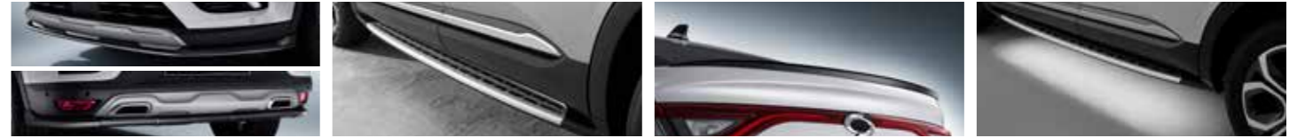
전후면 바디키트 395,000원 사이드 스텝 395,000원 리어 스포일러 150,000원 언더바디 램프라이트 180,000원

2가지 컬러: ■ 블랙, ■ 실버 중 선택 ※ 바디키트는 차량바디컬러와 상관없이 취향에 따라 선택 가능합니다. ■ 메탈릭 블랙, ■ 어반 그레이, ■ 하이랜드 실버, ■ 클라우드 펄 ※ 신차출고시 리어 스포일러는 차량바디컬러와 상관없이 상기 4가지 컬러 장착이 가능합니다. (단 전국서비스거점 및 용품점에서 별도 추가비용 도장장착문의 가능합니다.) 차량 연락 시 은은한 LED 조명에 바닥을 비추어 야간 차량 위치 확인 및 승객 승하차를 돕습니다. ※ 사이드 스텝과 중복 선택이 가능하며 이 경우 반드시 사이드 스텝용을 선택해야 합니다.