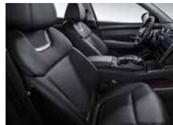
블랙 모노톤 가죽 시트