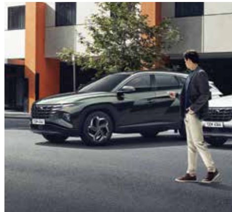
원격스마트 주차 보조(디젤/하이브리드)