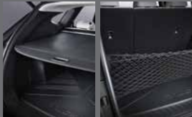
러기지 스크린 러기지 넷