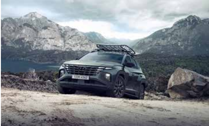
*어드벤처 루프바스켓 및 어드벤처 크로스바는 현대 Shop (Shop.Hyundai.com) 현대 브랜드관에서 구매 가능