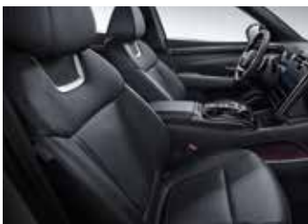
네이비 모노톤 가죽 시트 (아마존 그레이 메탈릭(A5G)/크림스 레드 펠(YP6)/실키브론즈 메탈릭(B6S) 외장컬러 선택 불가)