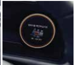
디지털 키 후석 승객 알람