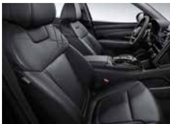
블랙 모노톤 인조가죽 시트