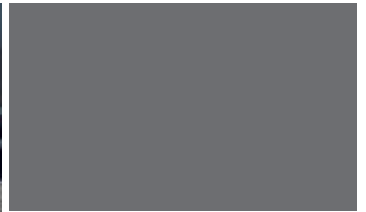
리어 스키드 플레이트 사이드 도어 가니쉬 / 퀴터가니쉬 & 리플렉터 / 어드벤처 전용 사이드 스텝(옵션)