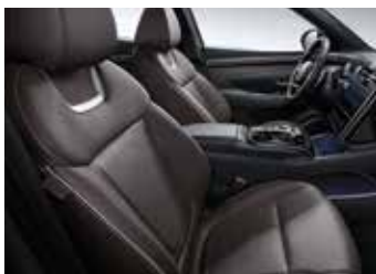
브라운 가죽 시트 (크림스 레드 펠(YP6)/오션인디고 펠(PS8) 외장컬러 선택 불가)