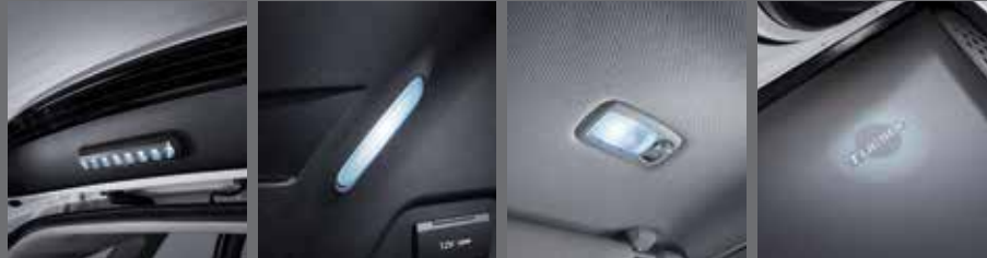
LED 테일게이트 램프(터치방식) LED 러기지 램프 LED 선바이저 램프 LED 도어스팟 램프