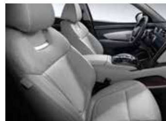
그레이 가죽 시트