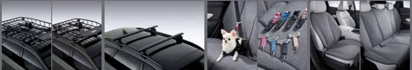
루프 바스켓(화장) / 루프 바스켓 크로스바 H Genuine 하네스 / 안전벨트 테더 / ISOFIX 안전벨트 동승석 시트 커버(1열) / 방오시트 커버(2열)

※ 커스터마이징 상품 애프터마켓 판매처: 현대Shop(Shop.Hyundai.com) 현대 브랜드관