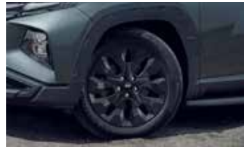
프론트 로워범퍼 휠아치 가니쉬 / 19인치 전용 알로이 휠 & 미쉐린 타이어