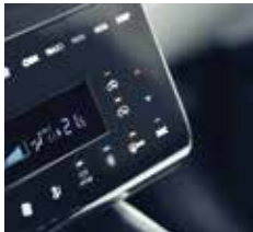
스마트폰 무선충전 멀티에어모드