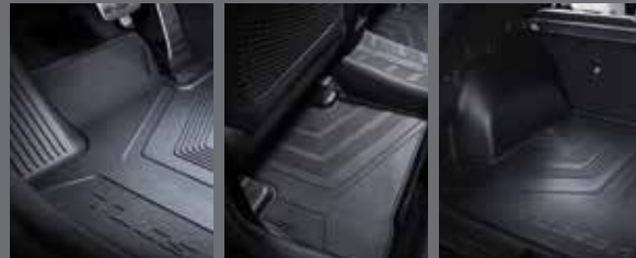
플로어 매트(1열) 플로어 매트(2열) 러기지 매트