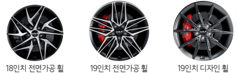
※ 19인치 전면가공 휠과 디자인 휠 이미지의 브렘보 브레이크는 퍼포먼스 패키지 선택 시 적용