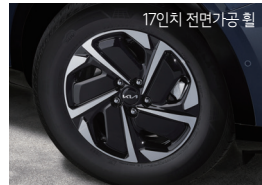
하이브리드 전용 휠