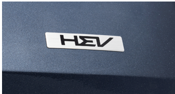
하이브리드 전용 엠블럼

상기 사양 구성은 차급 및 선택 사양에 따라 다르게 적용됩니다. ※ 본 인쇄물에 수록된 제품 색상 및 이미지는 실제와 다를 수 있습니다.