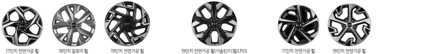
17인치 전면가공 휠