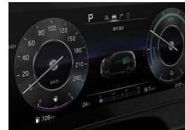
하이브리드 전용 컨텐트