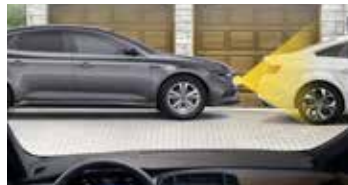
아이나비 V9 내비게이션