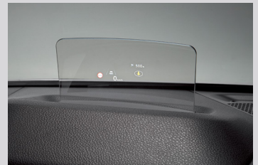
컴바이너 헤드업 디스플레이