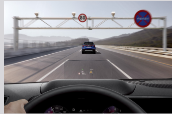
지능형 속도 제한 보조