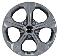
16인치 알로이 휠