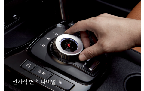
전자식 변속 다이얼