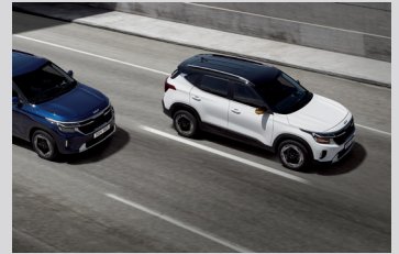
후측방 충돌방지 보조