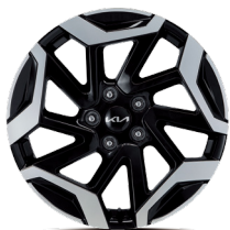
18인치 전면가공 휠