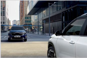
전방 충돌방지 보조 (차량 / 보행자 / 자전거 탑승자 / 교차로 대향차)

기아의 첨단 운전자 보조 시스템과 신규 편의사양으로 더욱 안전하고 편리해진 드라이빙 경험을 제공합니다.