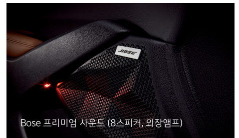
Bose 프리미엄 사운드 (8스피커, 외장앰프)