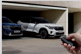
원격 스마트 주차 보조