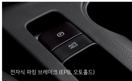
전자식 파킹 브레이크 (EPB, 오토홀드)