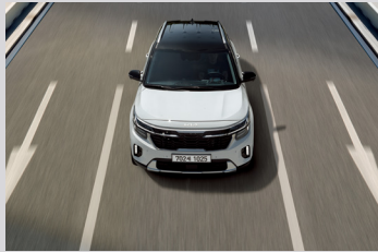
차로 유지 보조