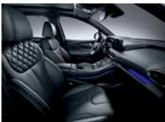
블랙 모노톤 가죽 시트