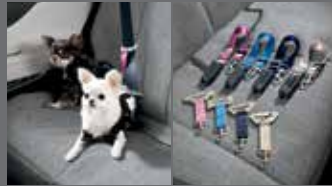
H Genuine 하네스 I 안전벨트 테더 / ISOFIX 안전벨트