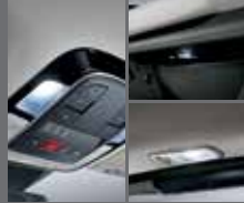
LED 오버헤드콘솔 램프/ LED 글로브박스 램프/ LED 라지지 램프