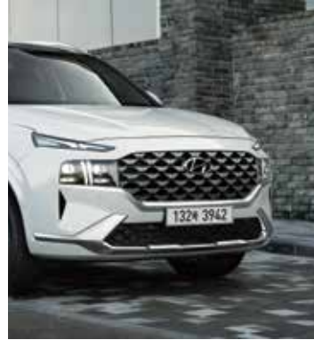
크롬 라디에이터 그릴 및 스키드 플레이트