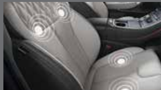
운전석, 조수석 진동 시트