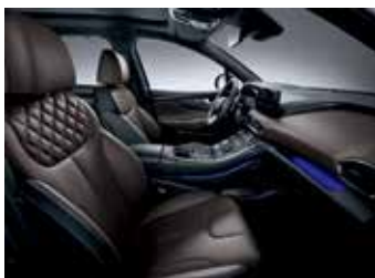
브라운 가죽 시트