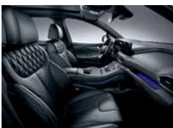
블랙 모노톤 나파가죽 시트