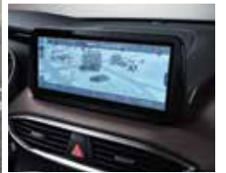
클러스터(12.3인치 컬러 LCD) 10.25인치 내비게이션