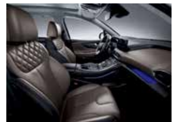
다크 베이지 가죽 시트