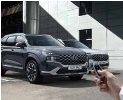
원격 스마트 주차 보조