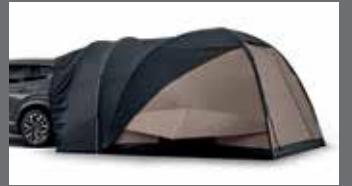
메가 팔레스 카텐트

※ 커스터마이징 상품 애프터마켓 판매처: 현대 Shop(Shop.Hyundai.com) 현대브랜즈관