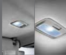
LED 선바이저 램프/LED 룸램프