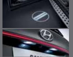
LED 도어스팟 램프/ LED 번호판 램프