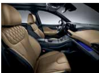
카멜 나파가죽 시트 (리군 블루 펠(UE3) 외장컬러 선택 불가)