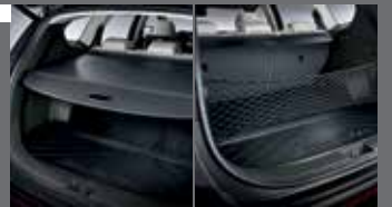
라지지 스크린/라지지 네트