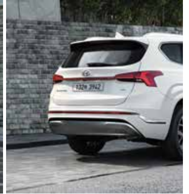
LED 리어 콤비램프 및 크롬 스키드 플레이트