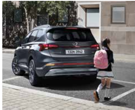
주차 충돌방지 보조-후방