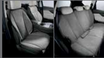
동승석 시트커버(1열) 방오시트커버(2열)