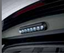
LED 테일게이트 램프(터치방식)