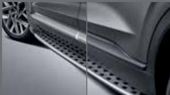
컬러 사이드 스텝(캘리그래피 전용)/ 사이드 스텝(프레스티지, 프리미엄 전용)