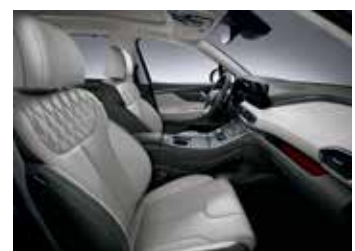
라이트 그레이 나파가죽 시트