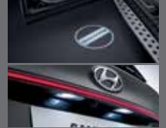
LED 도어스팟 램프/ LED 번호판 램프