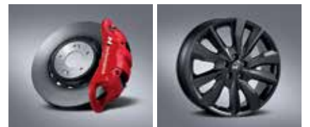
모노블록 4P 캘리퍼, 하이브리드 디스크, 로우 스틸 패드