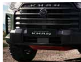
블랙 프론트 너트지바