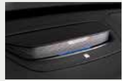
플로팅 무드 스피커