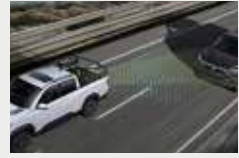
후측방 충돌 보조(BSA)