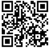
렉스턴 스포츠 칸