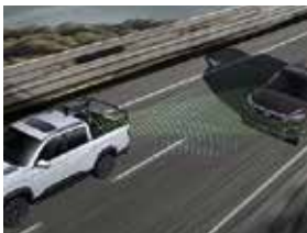
후측방 충돌 보조(BSA)