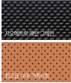
지오메트릭 패턴 그레이인