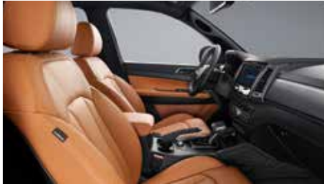
브라운 인테리어(블랙 헤드라이닝)