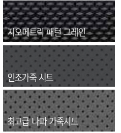
지오메트릭 패턴 그레이인