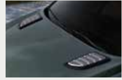
후드 패션 가니쉬