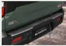
리어범퍼 SUS 물딩