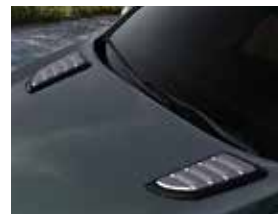
후드 패션 가니쉬