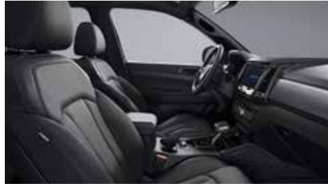
블랙 인테리어(블랙 헤드라이닝)