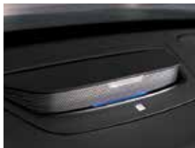
플로팅 무드 스피커