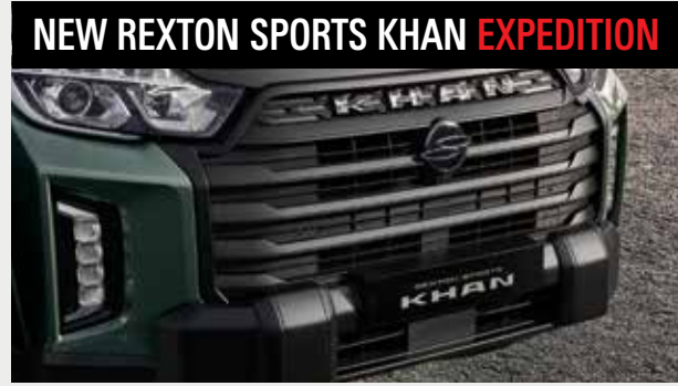
블랙 라디에이터 그릴 & 프론트 넛지바