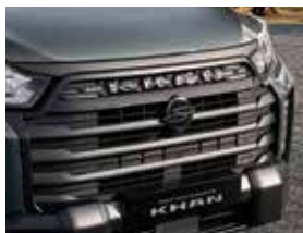
블랙 라디에이터 그릴