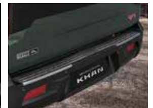
리어범퍼 SUS 몰딩