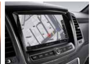
9인치 인포콘 내비게이션(선택사양)