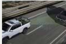
후측방 충돌 보조(BSA)