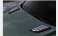
후드 패션 가니쉬