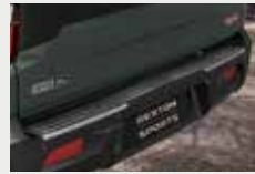
리어범퍼 SUS 몰딩