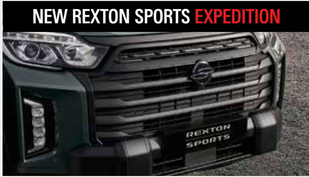
블랙 라디에이터 그릴 & 프론트 닷지바