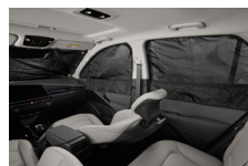
멀티 커튼 (전면/1열/2열)