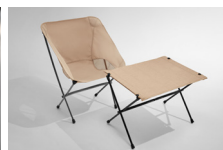
캠핑 의자 & 테이블