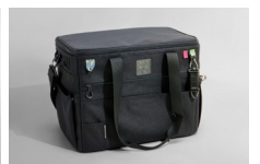
캠핑용 수납 가방