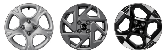
14인치 스틸 휠 (폴사이즈 휠커버) 14인치 알로이 휠 16인치 전면가공 휠