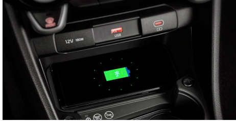
스마트폰 무선충전 시스템