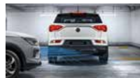
후측방 접근 충돌 보조 RCTA