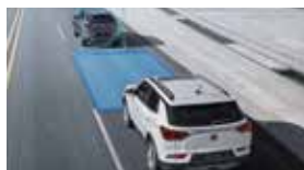
안전 거리 경고 SDW