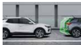
앞차 출발 경고 FVSW