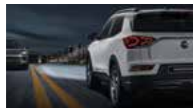
스마트 하이빔 SHB