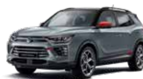
바디컬러 플래티넘 그레이