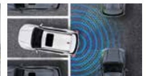
후측방 접근 경고 RCTW