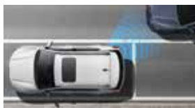
안전 하차 경고 SEW

카메라와 레이더를 통해 주변 상황을 완벽하게 스캐닝하고 차량을 안전하게 제어해 주는 최첨단 자율주행 시스템입니다.