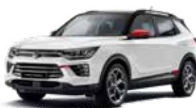
바디컬러 그랜드 화이트