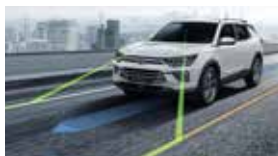
중앙 차선 유지 보조 CLKA