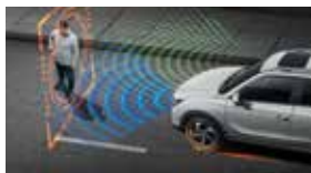
긴급 제동 보조 AEB