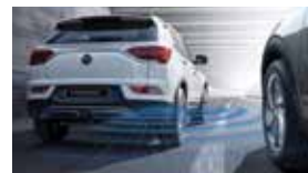
후측방 경고 BSW