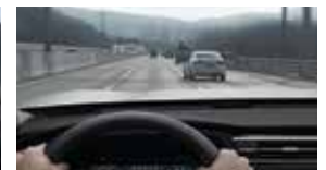
고속도로 및 고속화도로 안전 속도 제어 SSA