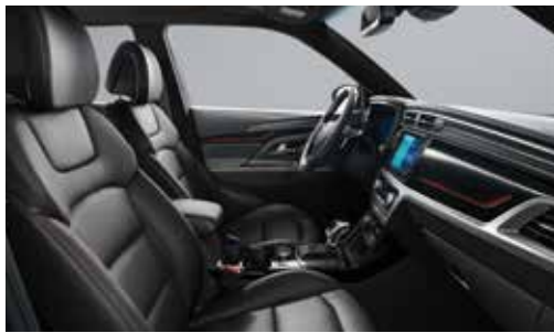
R-PLUS 전용 인테리어(블랙 헤드라이닝)