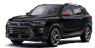
바디컬러/루프/리어 스포일러/ 패션 루프랙 스페이스 블랙