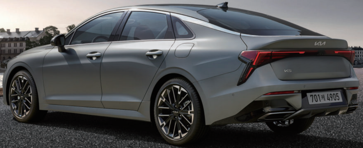
문스케이프 매트 그레이 (KLM)