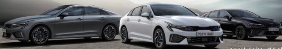
1.6 가솔린 터보