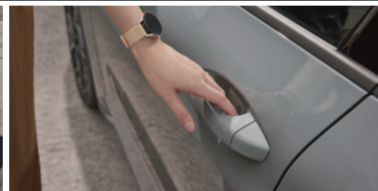
디지털 키 2

※ 상기 사양 구성은 차급 및 선택 사양에 따라 다르게 적용됩니다. ※ 본 인쇄물에 수록된 제품 색상 및 이미지는 실제와 다를 수 있습니다.