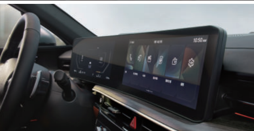
12.3" 파노라믹 커브드 디스플레이