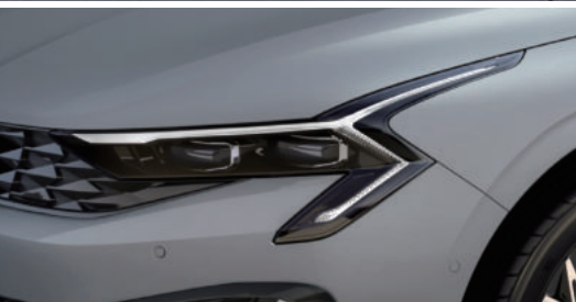
프로젝션 LED 헤드램프