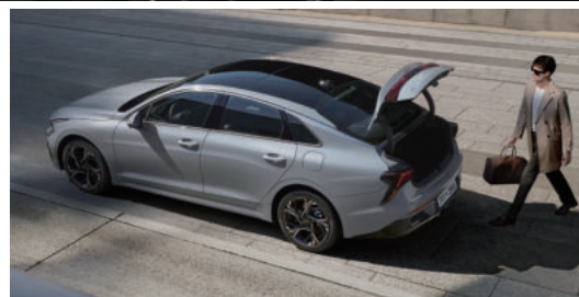
전동식 세이프티 파워트렁크