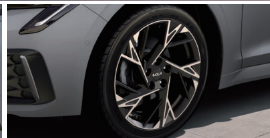
18인치 전면가공 휠