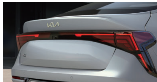
LED 리어 콤비네이션 램프