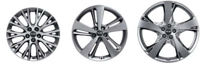
19인치 다이아몬드 커팅 휠