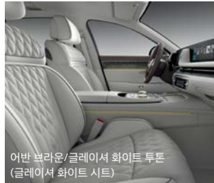
어반 브라운/글레이셔 화이트 투톤 (글레이셔 화이트 시트)