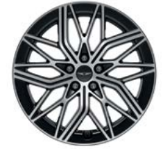
19인치 다이아몬드 커팅 휠