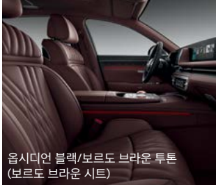
옵시디언 블랙/보르도 브라운 투톤 (보르도 브라운 시트)