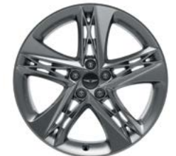
20인치 다크 하이퍼 실버 휠