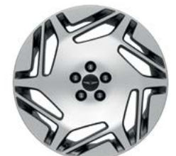
20인치 다이아몬드 커팅 휠 (GENESIS G90 LONG WHEEL BASE 전용)