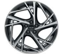
20인치 다이아몬드 커팅 휠