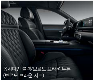
옵시디언 블랙/보르도 브라운 투톤 (보르도 브라운 시트)