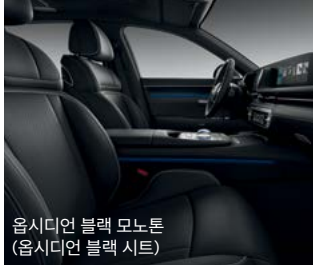
옵시디언 블랙 모노톤 (옵시디언 블랙 시트)