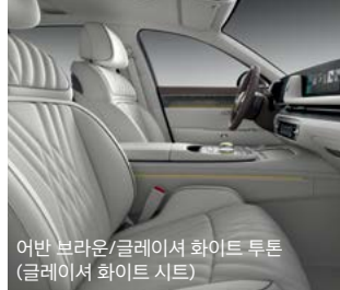
어반 브라운/글레이셔 화이트 투톤 (글레이셔 화이트 시트)