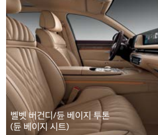
벨벳 버건디/뉘 베이지 투톤 (뉘 베이지 시트)