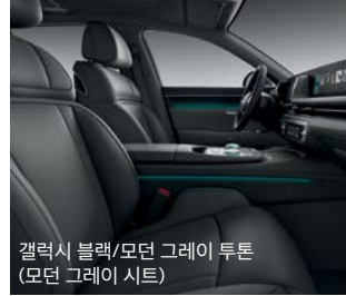
갤럭시 블랙/모던 그레이 투톤 (모던 그레이 시트)