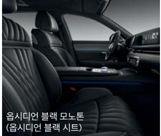
옵시디언 블랙 모노톤 (옵시디언 블랙 시트)