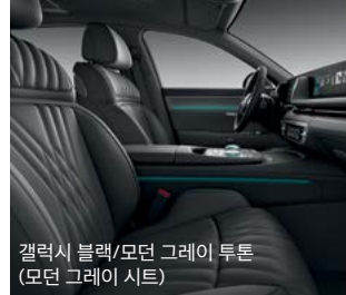
갤럭시 블랙/모던 그레이 투톤 (모던 그레이 시트)