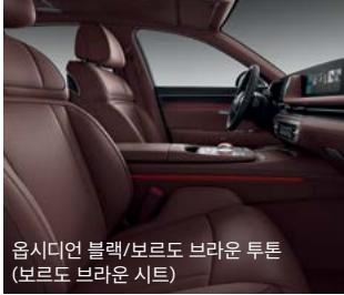
옵시디언 블랙/보르도 브라운 투톤 (보르도 브라운 시트)