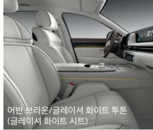
어반 브라운/글레이셔 화이트 투톤 (글레이셔 화이트 시트)