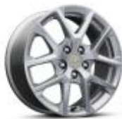
17인치 알로이 휠 LS