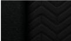
젯 블랙 데님 직물시트 LS