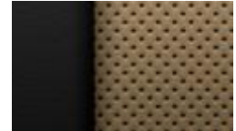
메이플 슈가 천연 가죽시트 PREMIER