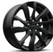
19인치 다크 안드로이드 알로이 휠 RS