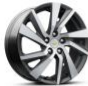
18인치 머신드 알로이 휠 LT