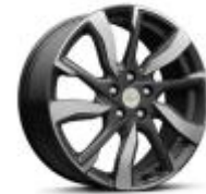
19인치 머신드 알로이 휠 PREMIER