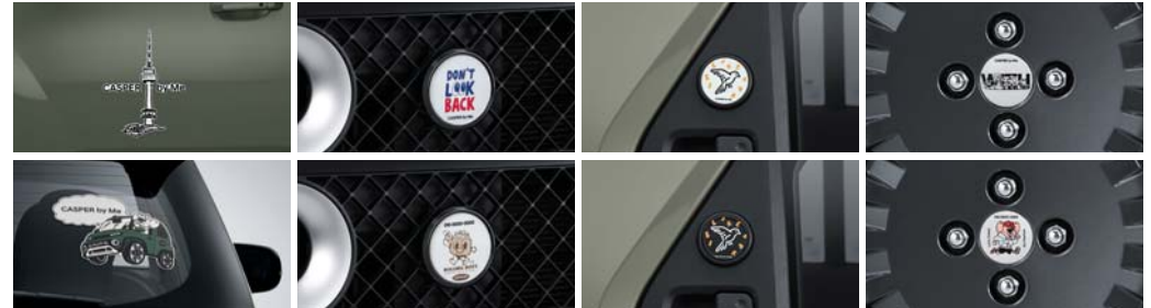
데칼(대형) / 데칼(중형) 그릴 뱃지 리어 도어 뱃지 휠캡

*동승석 시트백 보드 트레이와 동승석 시트백 보드 테이블은 스토리지 옵션 선택 시 장착 가능합니다. *동승석 시트백 보드 테이블을 차량 내부에 장착시 동승석 시트백 보드 트레이가 먼저 장착된 상태에서 장착이 가능합니다. *공간활용의 기술 / 여행의 정석 (for Camping) 카테고리 내 루프 박스, 루프 바스켓, 러기지 박스는 모두 동일한 상품입니다. *액티브 플러스 옵션 적용 시 루프 박스 장착이 불가능합니다. *루프 바스켓에 물건을 적재하여 주행 시 루프 바스켓 상단에 카고 넷을 설치할 것을 권장하며, 루프 박스는 내비게이션 미선택 차량에 적용되는 폴안테나와 간섭이 발생하는 점 참고하시기 바랍니다. *에어 매트는 좌측 사용을 기준으로 제작되었으며, 필요 시 2개를 좌우 대칭으로 설치하여 활용 가능합니다. *에어 매트 사용 시, 러기지 공간으로 인해 안전 평탄화가 되지 않습니다. 러기지 박스 상품을 결합하면 평탄화에 도움이 될 수 있습니다. *스토리지 옵션 적용 차량에서 에어 매트 사용 시, 시트백 보드로 인해 동승석쪽은 안전 평탄화가 되지 않습니다. *루프 박스, 루프 바스켓, 사이드 어닝, 크로스 바는 VAN차량에 장착 불가능합니다. (루프랙 적용 차량에 장착 가능) *보냉백 & 피크닉 매트 상품에 동승석 시트백 보드 테이블은 포함되지 않습니다. (별도 구매 상품) *Hyundai by Me는 고객 맞춤형 액세서리 제작 서비스로 현대 Shop(shop.hyundai.com)에서 이용 가능합니다. *상기 이미지는 예시 이미지로, 품목 구매 시 원하는 디자인 시안 선택 및 문구 입력이 가능한 상품입니다. *데칼은 소형/중형/대형 사이즈로 선택이 가능합니다. *반려견 사다리는 VAN이 아닌 일반 차량에도 적용이 가능합니다.