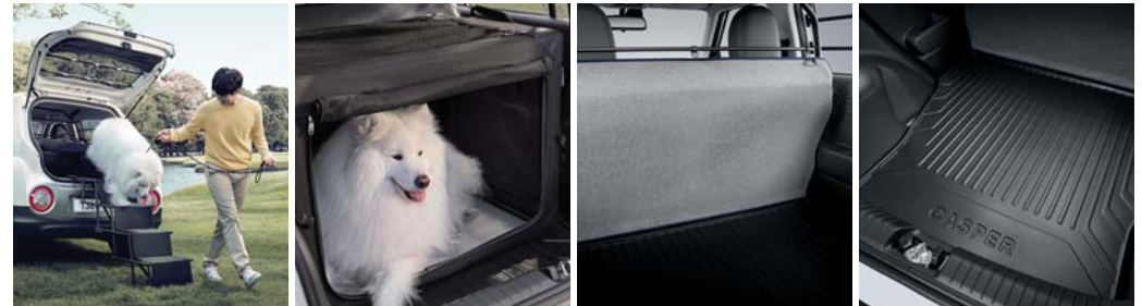
반려견 사다리 켄넬 파티션 보드 방오 커버 2열 방오매트