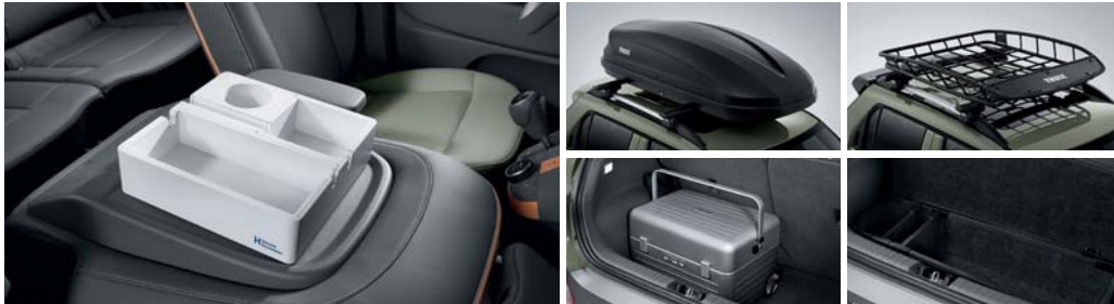
동승석 시트백 보드 트레이 루프 박스 루프 바스켓 캠핑 트렁크 러기지 박스