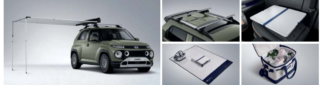
사이드 어닝 크로스 바(사이드 어닝 전용) 동승석 시트백 보드 테이블 피크닉 매트 보냉백