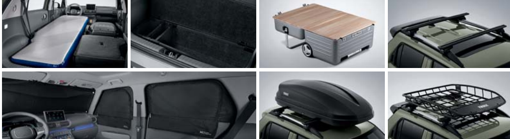
에어 매트 러기지 박스 캠핑 트렁크 크로스 바 멀티 커튼(천면/1열/2열) 루프 박스 루프 바스켓