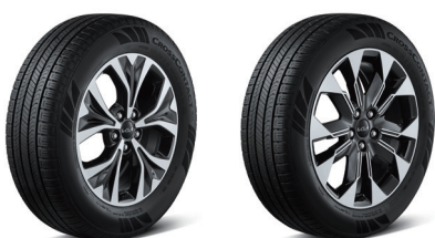
235/60 R18 타이어&전면가공 휠