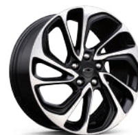
17 인치 머신드 블랙 투톤 알로이 휠