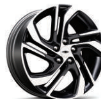
17 인치 머신드 블랙 투톤 알로이 휠