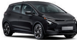
미드나이트 블랙 (GB8)