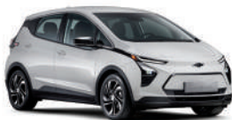
퓨어 화이트 (GAZ)