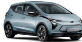
아이스 블루 (G7X)