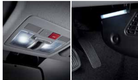
무선충전기 실내 LED 램프(오버헤드콘솔/룸/선바이저/풋우더/러기지)