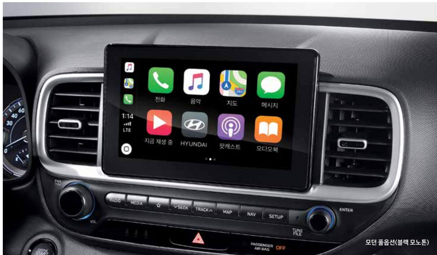
모던 풀옵션(블랙 모노톤)

8인치 내비게이션 8인치 심리스 디스플레이로 미래지향적 이미지와 시각적인 안정감을 전달합니다. 스마트폰의 주요 기능을 조작하고 디스플레이에 표시하는 폰 프로젝트, 음성인식 차량 제어 등 최신 테크놀로지가 적용된 VENUE의 인포테인먼트 시스템은 새롭고 즐거운 경험을 제공합니다. 또한 내비게이션을 무선으로 업데이트하여 차량을 항상 최신 상태로 유지할 수 있습니다.