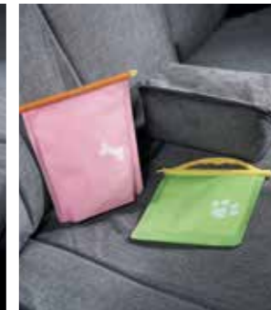
목줄, 리드줄(소형/중형) 포터블 포켓(먹이용/배변용) & 멀티 파우치