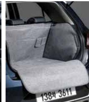
방오시트커버(2열) 러기지 매트 커버