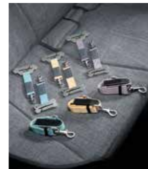
H Genuine 하네스 I (차량용, 소형/중형) 안전벨트 테더, ISOFIX 안전벨트