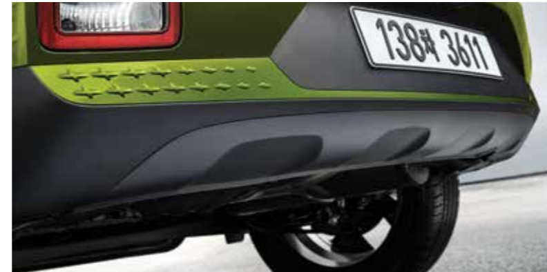
C필러 배지 FLUX 전용 리어스키드