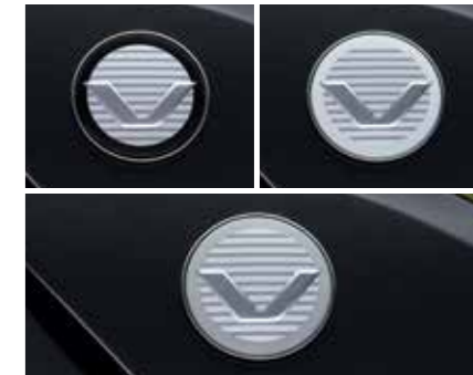
아웃사이드 미러 커버(메탈실버) C필러 뱃지(블랙/화이트/그레이)

* 공기주입식 에어카텐트 판매처: 제드코리아(zedkorea.co.kr) * H Genuine Accessories 상품 애프터마켓 판매처: 현대 Shop(Shop.Hyundai.com) 현대브랜드관 단, 펫패키지 상품은 차량 구매 시에도 옵션으로 선택 가능(해당 월가격표 참조)