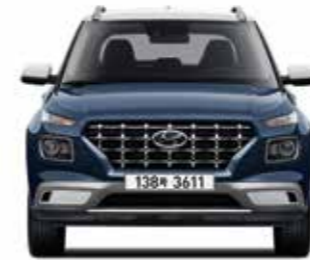
윤거전 1,535 전폭 1,770