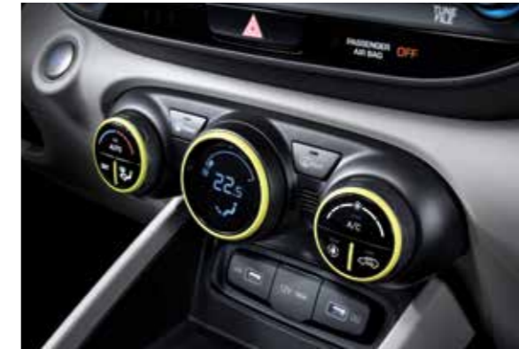
에어벤트 풀오토 에어컨