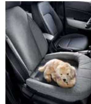
동승석 시트커버(1열) 시트커버 쿠션(1열)