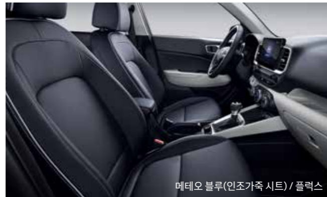
메테오 블루(인조가죽 시트) / 플렉스