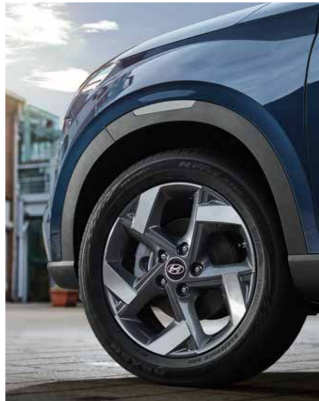
17인치 알루미늄 휠 & 타이어