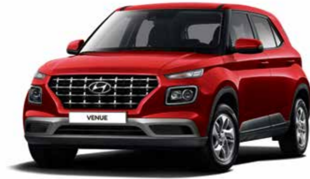
스마트 풀옵션(파이어리 레드 펠)