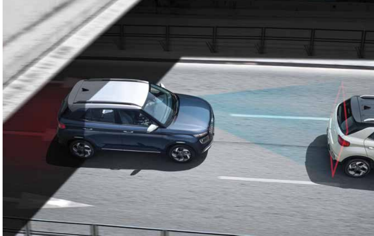
전방 충돌 방지 보조 선행 차량이 갑자기 속도를 줄이거나, 앞에 정지 차량 혹은 보행자가 나타나는 등 전방 충돌 위험이 감지되면 경고를 해줍니다. 경고 후에도 충돌 위험이 높아지면 자동으로 제동을 도와줍니다.