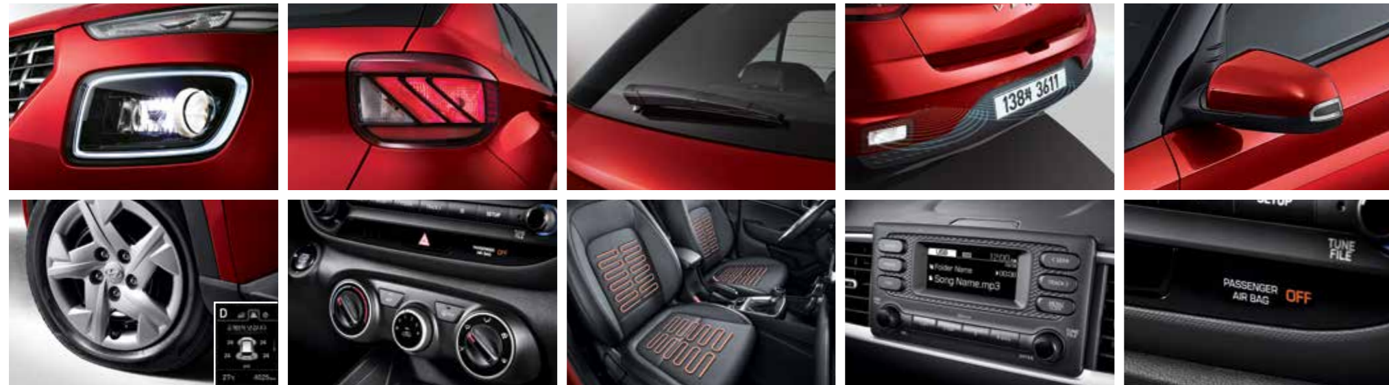
프로젝션 헤드램프(스태틱 벤딩 라이트 포함) & LED 주간주행등(DRL, 포지셔닝 기능 포함) 개별 타이어 공기압 경보장치 리어 콤비램프 매뉴얼 에어컨 리어 와이퍼 앞좌석 열선시트 주차 거리 경고-후방 오디오(라디오/MP3) 아웃사이드 미러(전동접이, LED방향지시등) 6에어백 시스템(앞좌석어드밴스드, 앞좌석사이드, 전복대응커튼)