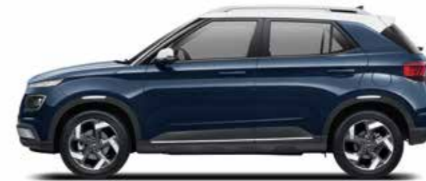
축간거리 2,520 전장 4,040