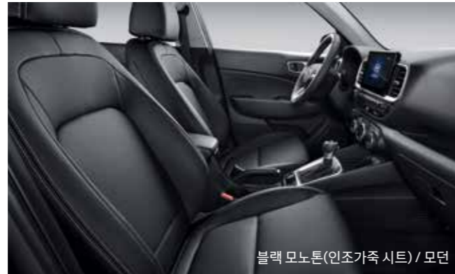
블랙 모노톤(인조가죽 시트) / 모던