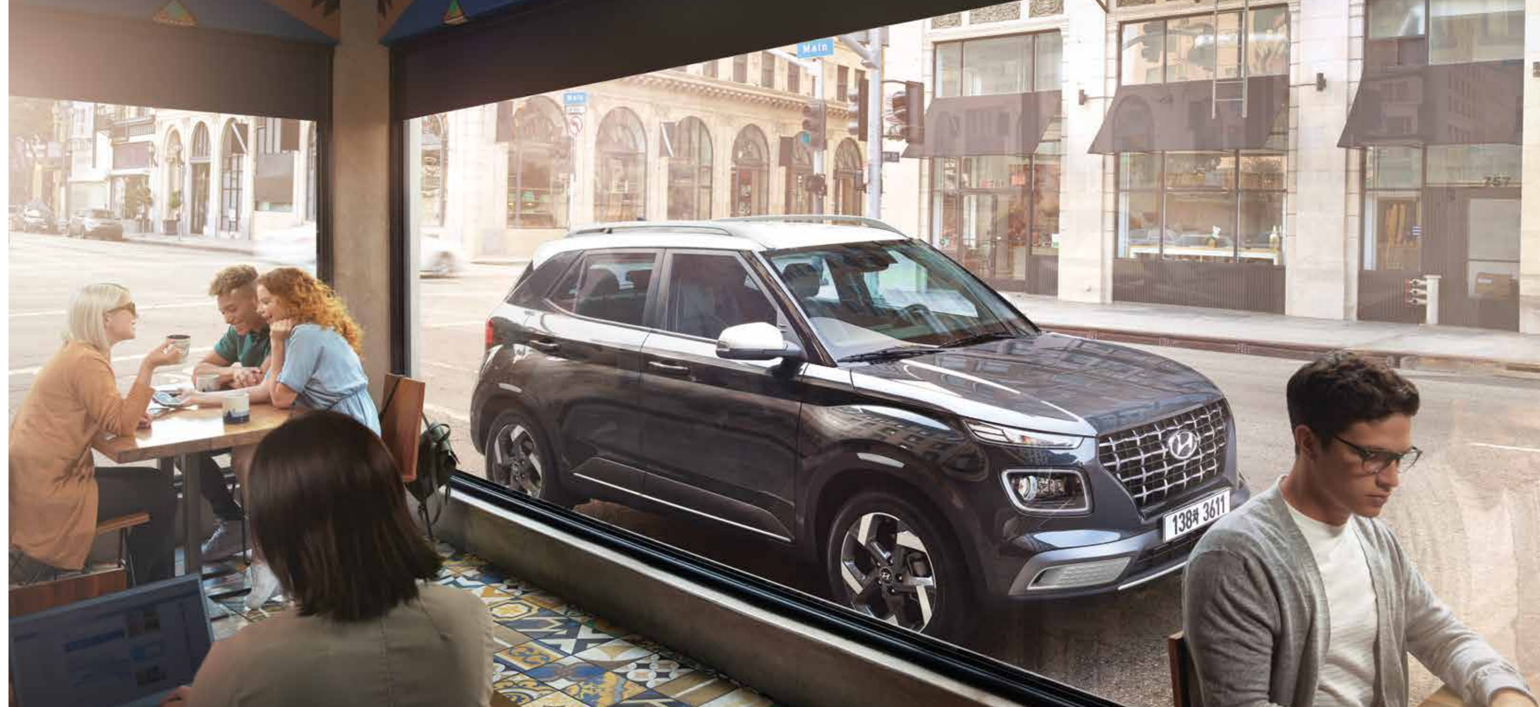
모던 풀옵션(데님 블루 펠/초크 화이트 메탈릭 투톤)