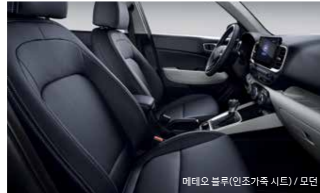
메테오 블루(인조가죽 시트) / 모던