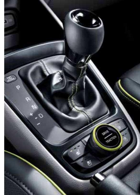
기어노브 & 2WD 험로 주행 모드 스위치

*그레이(인조가죽 시트)인테리어 선택 시 라임 컬러 포인트 적용 예시 이미지입니다. (블랙 내장, 메테오 블루 내장 적용 시 각각 화이트, 라이트 실버 컬러 포인트 적용)