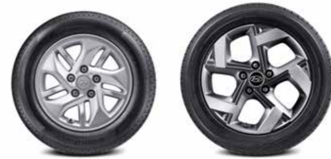
185/65R15 타이어 & 15인치 알로이 휠 205/55R17 타이어 & 17인치 알로이 휠