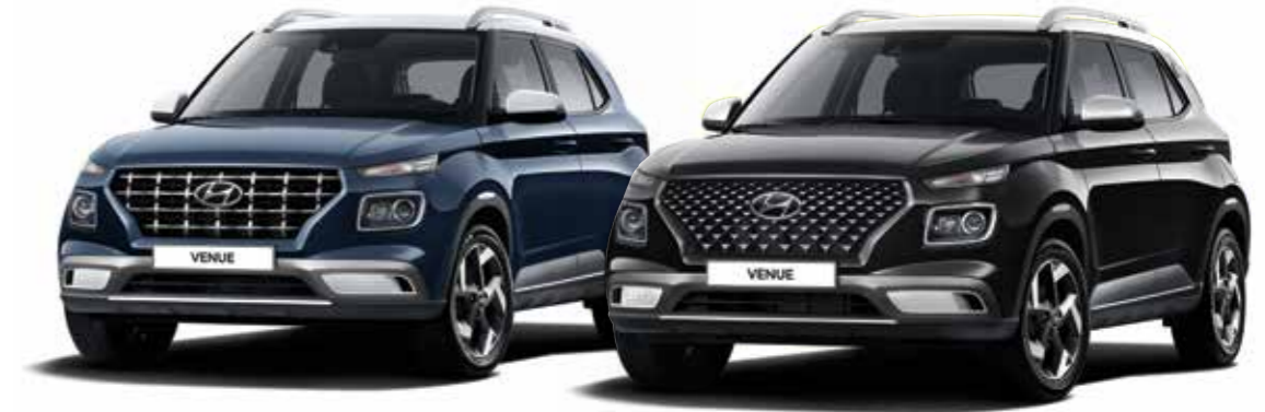
모던 풀옵션(데님 블루 펠/초크 화이트 메탈릭 투톤) / 플럭스 풀옵션(팬텀 블랙 펠/초크 화이트 메탈릭 투톤)