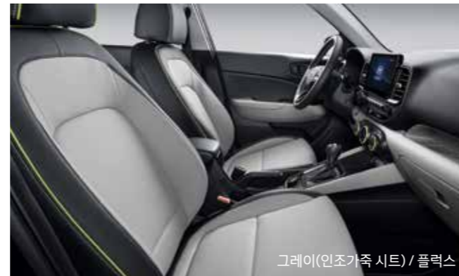
그레이(인조가죽 시트) / 플렉스

*트림, 패키지별 적용 사양 상이) 모델별 자세한 사양은 해당 월의 가격표를 참고하시기 바랍니다.