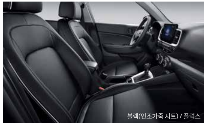
블랙(인조가죽 시트) / 플렉스