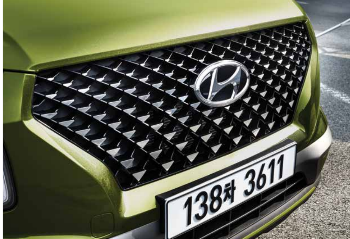
FLUX 전용 핫스탬핑 라디에이터 그릴