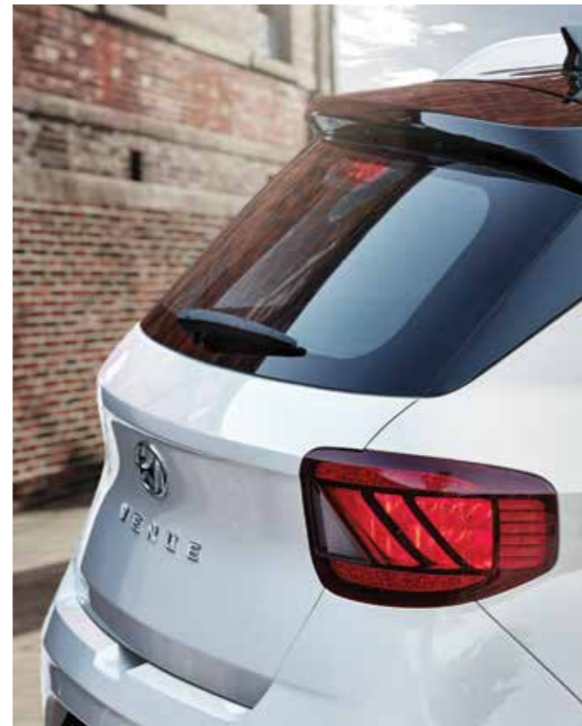
LED 리어 콤비램프