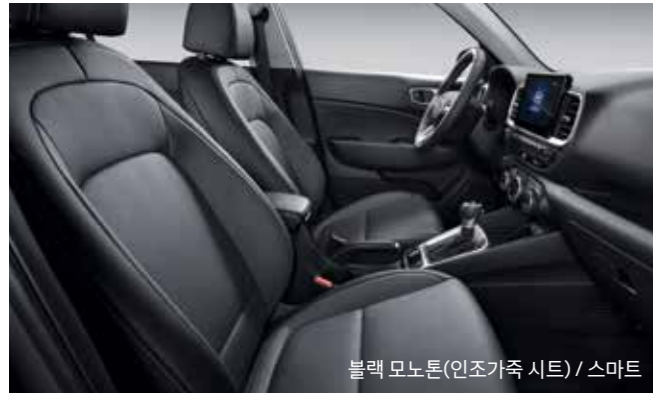
블랙 모노톤(인조가죽 시트) / 스마트