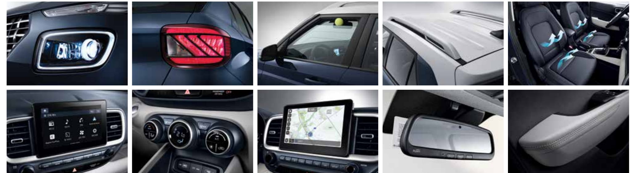
LED 헤드램프 LED 리어 콤비램프 운전석 파워 세이프티 윈도우 루프랙 앞좌석 통풍시트 8인치 디스플레이 오디오 풀오토 에어컨 8인치 내비게이션 하이패스 시스템(ECM 적용) 인조가죽 도어 암레스트