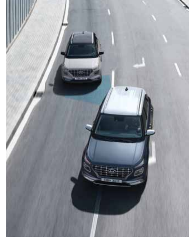
후측방 충돌 경고 차로 변경을 위하여 방향지시등 스위치를 움직였을 때, 후측방 차량과 충돌 위험이 감지되면 경고를 해줍니다.