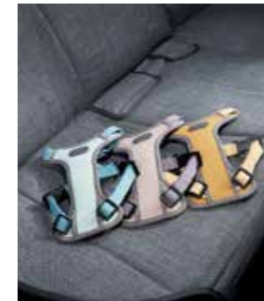
쿨홀더도이(1/2열 공용) H Genuine 하네스 II (일상생활용, 소형/중형)