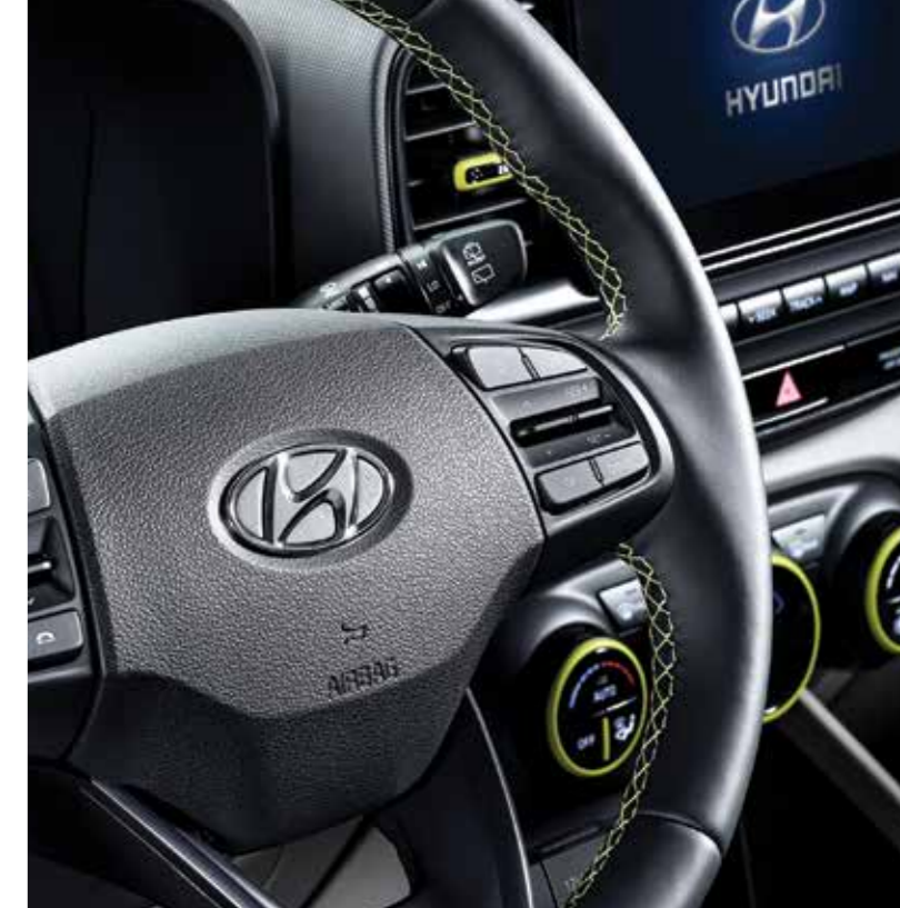
가죽 스티어링 휠(FLUX 전용 스티치 포함)