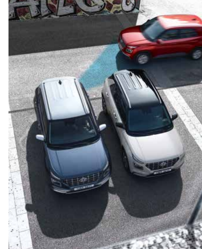
후방 교차 충돌 경고 후진 중 좌/우측에서 다가오는 차량과 충돌 위험이 감지되면 경고를 해줍니다.