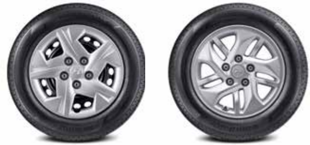
185/65R15 타이어 & 15인치 스틸 휠 185/65R15 타이어 & 15인치 알로이 휠