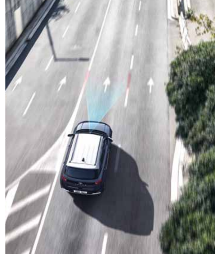
차로 이탈 방지 보조 일정 속도 이상 주행 중 방향지시등 스위치를 움직이지 않고 차로를 이탈하면 경고를 해줍니다. 차로 이탈이 감지되면 자동으로 조향을 보조하여 차로를 이탈하지 않도록 도와줍니다.