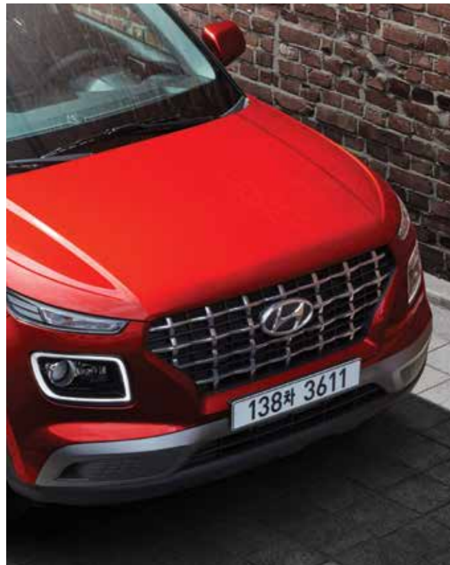
캐스캐이딩 그릴 / LED 헤드램프