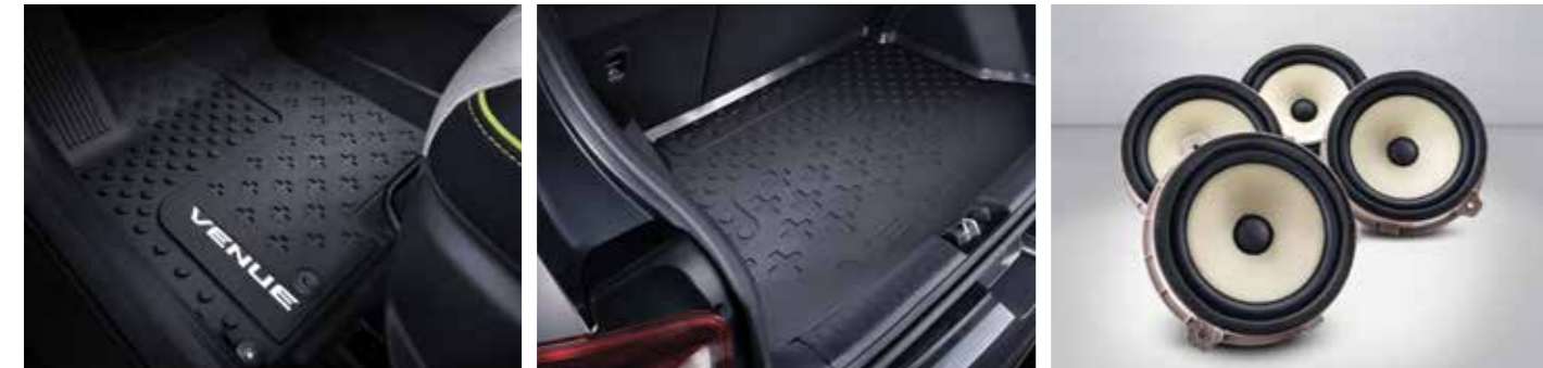
적외선 무릎 워머 프로텍션 매트 패키지(플로어 매트, 러기지 매트)