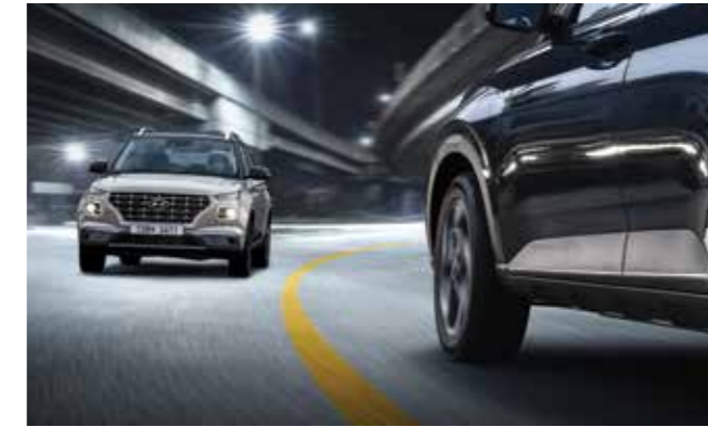
운전자 주의 경고 주행 중 운전자의 주의 운전 상태를 표시해주며, 운전자 주의 수준이 "나쁨"으로 떨어지면 경고를 해줍니다.