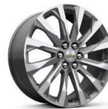
20인치 아전트 메탈릭 머신드 알로이 휠 (Premier 전용)