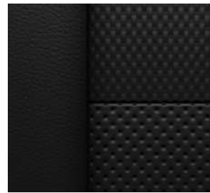
젯 블랙 & 레드 포인트 천연가죽 시트 (RS 전용)