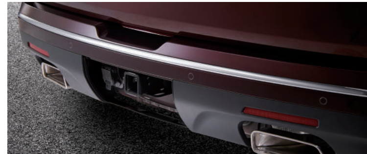
히든 순정 트레일러 히치 리시버 & 미국식 7핀 커넥터 트레일러 히치 가이드 라인 히치 뷰 모니터링

트레일러 연결부를 zoom하여 센터 디스플레이에 보여주는 히치 뷰 모니터링 기능(탑 뷰)은 트레일러 연결 시 쉬운 체결을 도와주며, 주행 중 차량 히치 리시버와 트레일러 연결부의 체결 상황을 실시간으로 볼 수 있습니다.