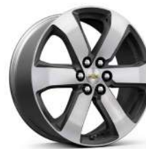
20인치 테크니컬 그레이 포켓 머신드 알로이 휠 (LT Leather Premium 전용)