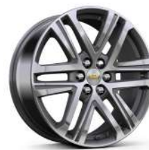
20인치 루나 그레이 머신드 알로이 휠 (High Country 전용)