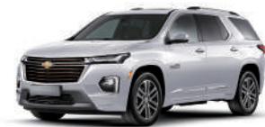
아발론 화이트 펄 (G1W)