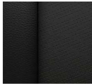
젯블랙 & 클로브 천공 천연가죽 시트 (High Country 전용)