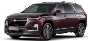
블랙 체리 (GLR)