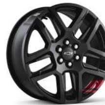
20인치 레드라인 시그니처 블랙 알로이 휠 (Redline 전용)