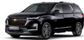
미드나이트 블랙 (GB8)