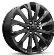
20인치 다크 안드로이드 페인티드 알로이 휠 (RS 전용)