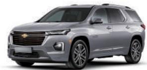
스위치블레이드 실버 (GAN)