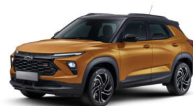
NEW 토피넛 브라운 (G98)