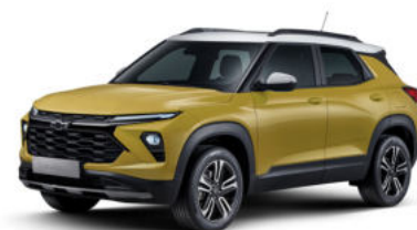
NEW 어반 옐로우 (GHS)