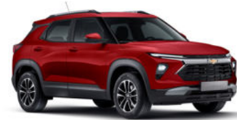
밀라노 레드 (GFM)