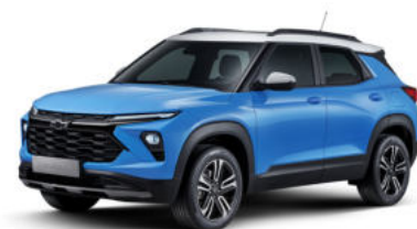
새비지 블루 (GLN)