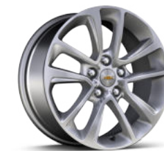
17인치 실버 알로이 휠 (LT 전용)