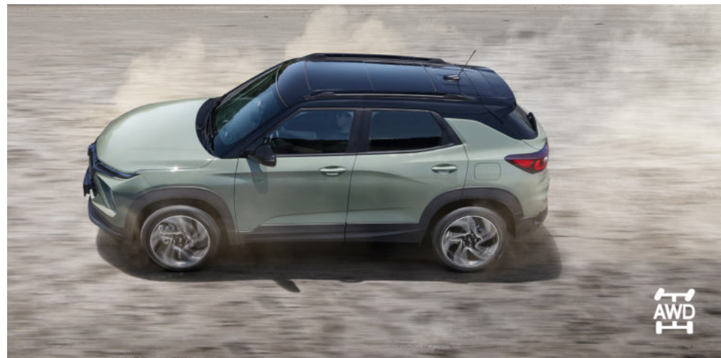
드라이브 모드 (스포츠/스노우) 스위처블 AWD 시스템