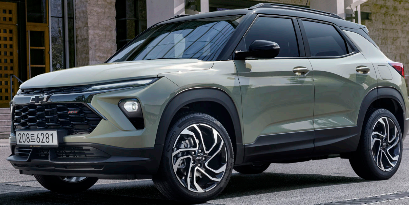
더 뉴 트레일블레이저 RS 피스타치오 카키