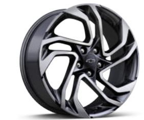
19인치 RS 카본 플래시 머신드 알로이 휠 (RS 전용)