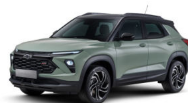
NEW 피스타치오 카키 (GVR)