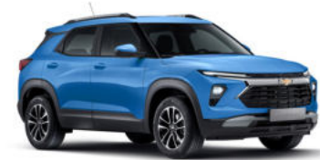
새비지 블루 (GLN)