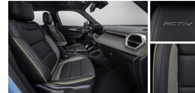
젯 블랙 & 아르테미스 포인트 인테리어 (ACTIV)