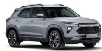
스털링 그레이 (GZB)