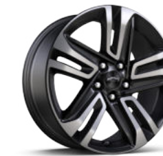
18인치 ACTIV 머신드 알로이 휠 (ACTIV 전용)