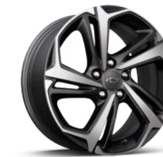
18인치 RS 머신드 알로이 휠 (RS 전용)