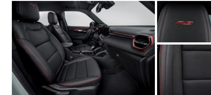
젯 블랙 & 레드 포인트 인테리어 (RS)

※ 상기 이미지는 컴포트 패키지가 선택 시 천공 천연 가죽시트가 적용된 이미지임 (LT & Premier)