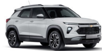
스노우 화이트 펄 (GP5)