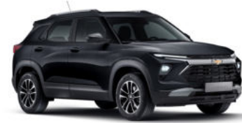
모던 블랙 (GB0)