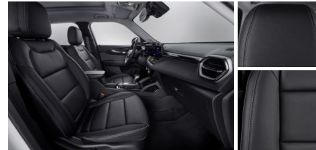
젯 블랙 & 빅토리아 헤링본 포인트 인테리어 (LT & Premier)