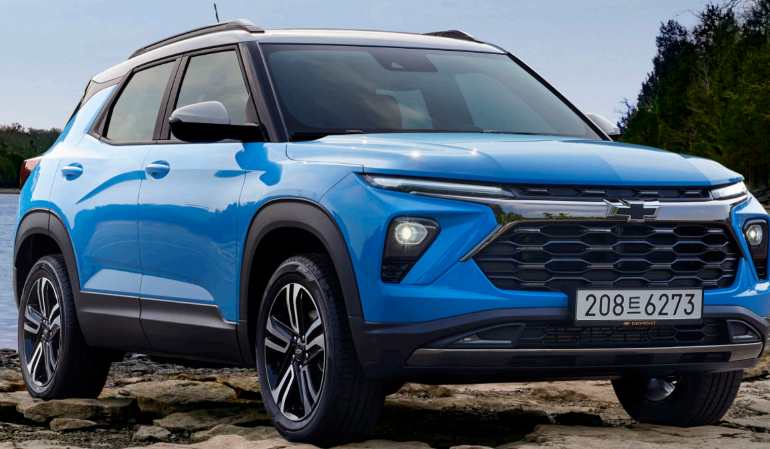
더 뉴 트레일블레이저 ACTIV 새비지 블루

블랙 루프랙 화이트 투톤 루프 & 아웃사이드 미러 쉐보레 블랙 보타이(앞, 뒤) 18인치 ACTIV 머신드 알로이 휠 티타늄 크롬 로워 범퍼 가니쉬 스퀘어 타입 듀얼 머플러