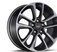
17인치 머신드 알로이 휠 (Premier 전용)