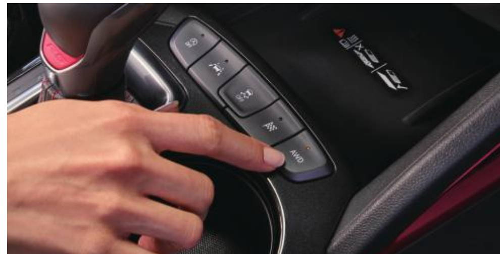
드라이브 모드 선택(노멀/스포츠/스노우) 스위처블 AWD 시스템