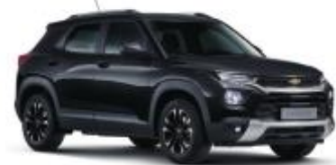
모던 블랙 (GB0)