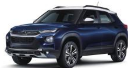
모나코 블루 (GGK)