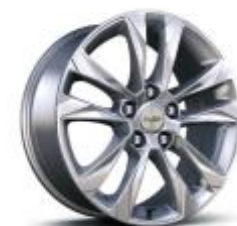
17인치 실버 알로이 휠 (LT 전용)