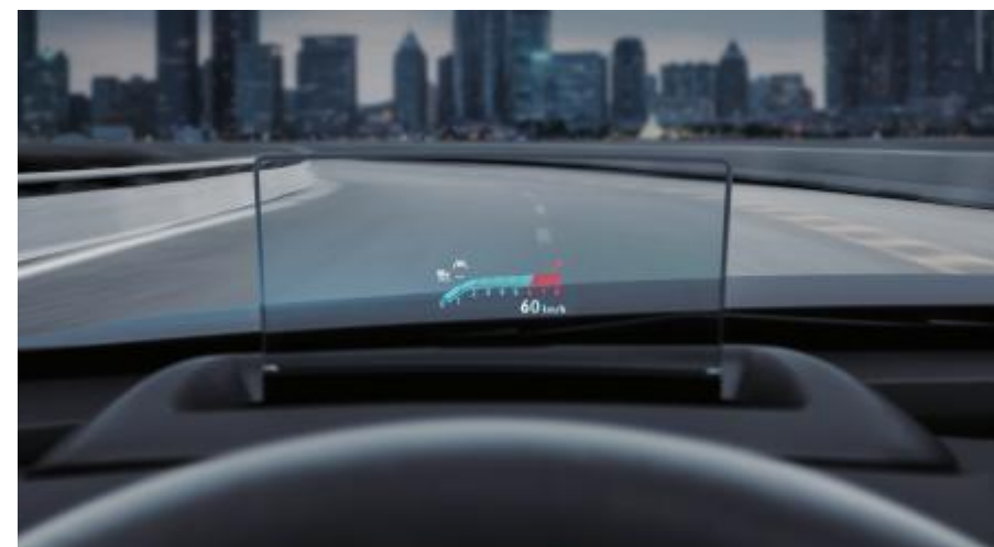
보타이 프로젝션 핸드프리 파워 리프트게이트 SkyFull(스카이풀) 파노라마 선루프 컴바이너 헤드업 디스플레이