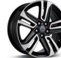
18인치 ACTIV 머신드 알로이 휠 (ACTIV 전용)