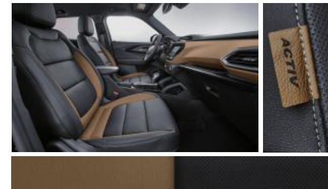
아몬드 버터 투톤 & 워시드 데님 포인트 인테리어 (ACTIV)