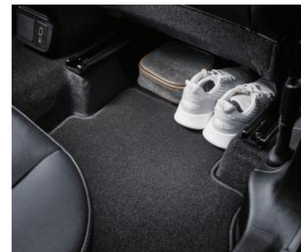
2열 4:6 폴딩 시트 및 2단 러기지 플로어 듀얼존 풀 오토 에어컨 열선 내장 스티어링 휠 어쿠스틱 윈드실드 글래스 (차음, 자외선 차단) 2열 플로어 스토리지