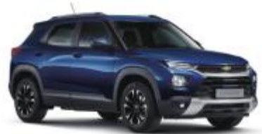
모나코 블루 (GGK)