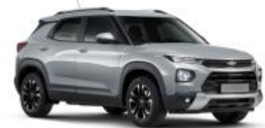
NEW 스틸링 그레이 (GZB)