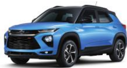
NEW 새비지 블루 (GLN)