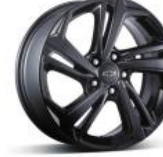
18인치 하이글로스 블랙 알로이 휠 (RS 미드나잇 전용)