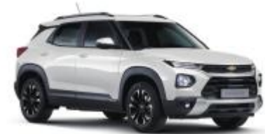
스노우 화이트 펄 (GP5)