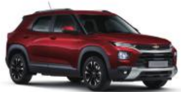
밀라노 레드 (GFM)