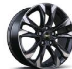
17인치 머신드 알로이 휠 (Premier 전용)