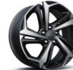
18인치 RS 머신드 알로이 휠 (RS 전용)