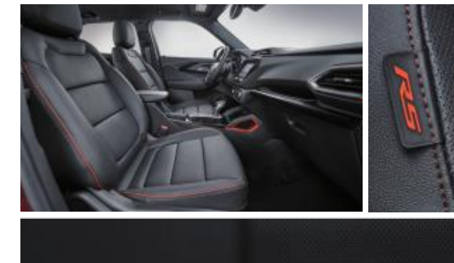
젯 블랙 & 레드 포인트 인테리어 (RS)

※ 상기 이미지는 컴포트 패키지 선택 시 천공 천연 가죽시트가 적용된 이미지임 (LT & Premier)