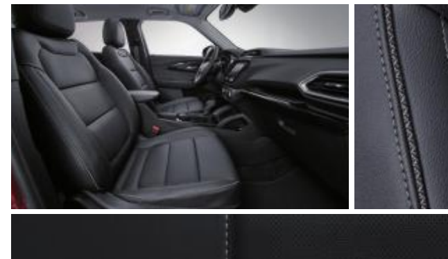
젯 블랙 & 빅토리아 헤링본 포인트 인테리어 (LT & Premier)