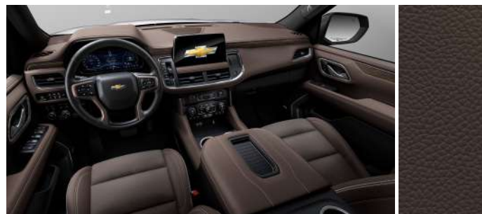
모카 브라운 천공 천연 가죽시트