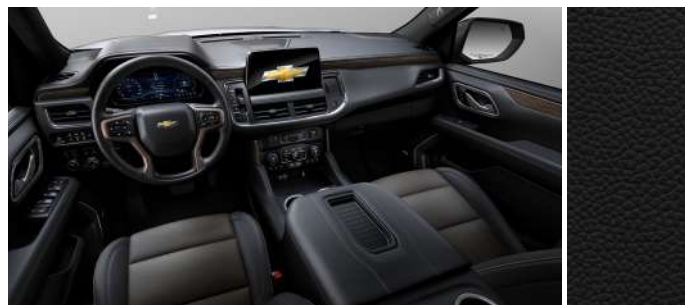
젯 블랙 천공 천연 가죽시트