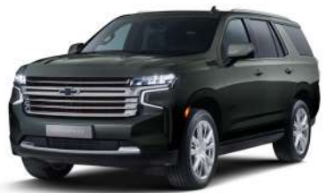
포레스트 던 (GED)