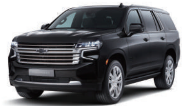
텍시도 블랙 (GBA)