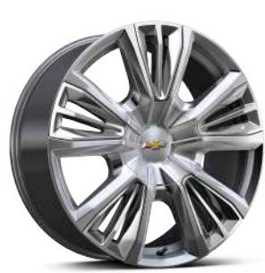
22인치 크롬 실버 프리미엄 페인티드 휠