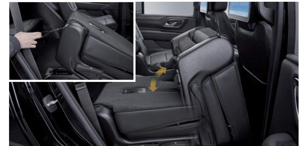
12" 컬러 LCD 클러스터 리어시트 미디어 (12.6" 듀얼 컬러 터치 디스플레이) 헤드레스트 하이컨트리 로고 스티칭 2열 파워 릴리스 캡틴시트