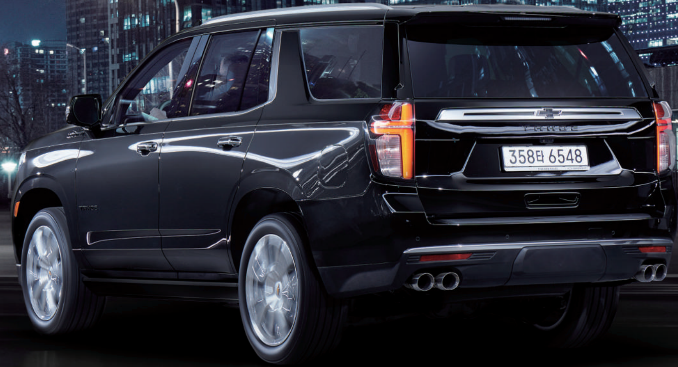
하이컨트리 로고 쿼드 머플러 팁