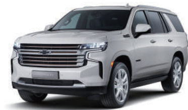
아발론 화이트 펄 (G1W)