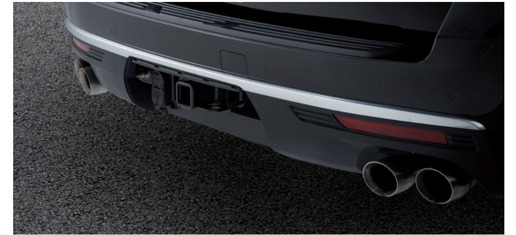
트레일러 히치 리시버 및 커넥터 히치 뷰 모니터링

히치뷰 카메라 기능과 트레일러 어시스트 가이드라인, 견인봉 감지 보상 기능을 통해 트레일러를 더욱 손쉽게 연결하실 수 있으며 차체 자세 제어 시스템 적용으로 트레일러 견인 시 스웨이를 효율적으로 제어해 더욱 편리하고 업그레이드된 라이프스타일을 경험하실 수 있습니다.