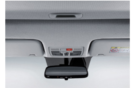
하운드투스 인테리어 (헤드라이닝)