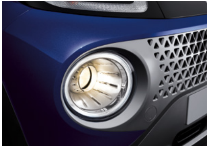
프로젝션 헤드램프 / LED 주간주행등