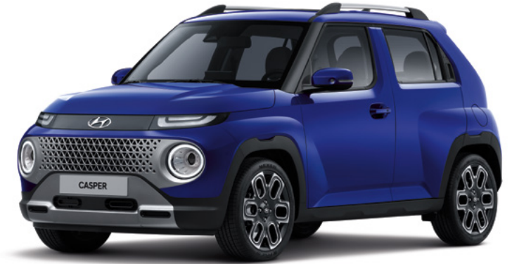
인스퍼레이션 (인텐스 블루 펄)