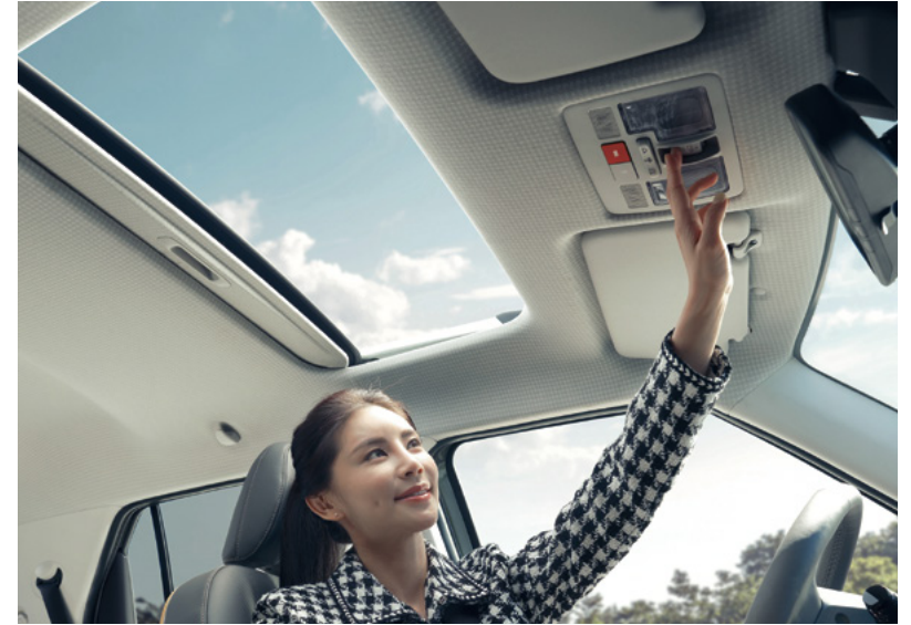
하운드투스 인테리어 (헤드라이닝)