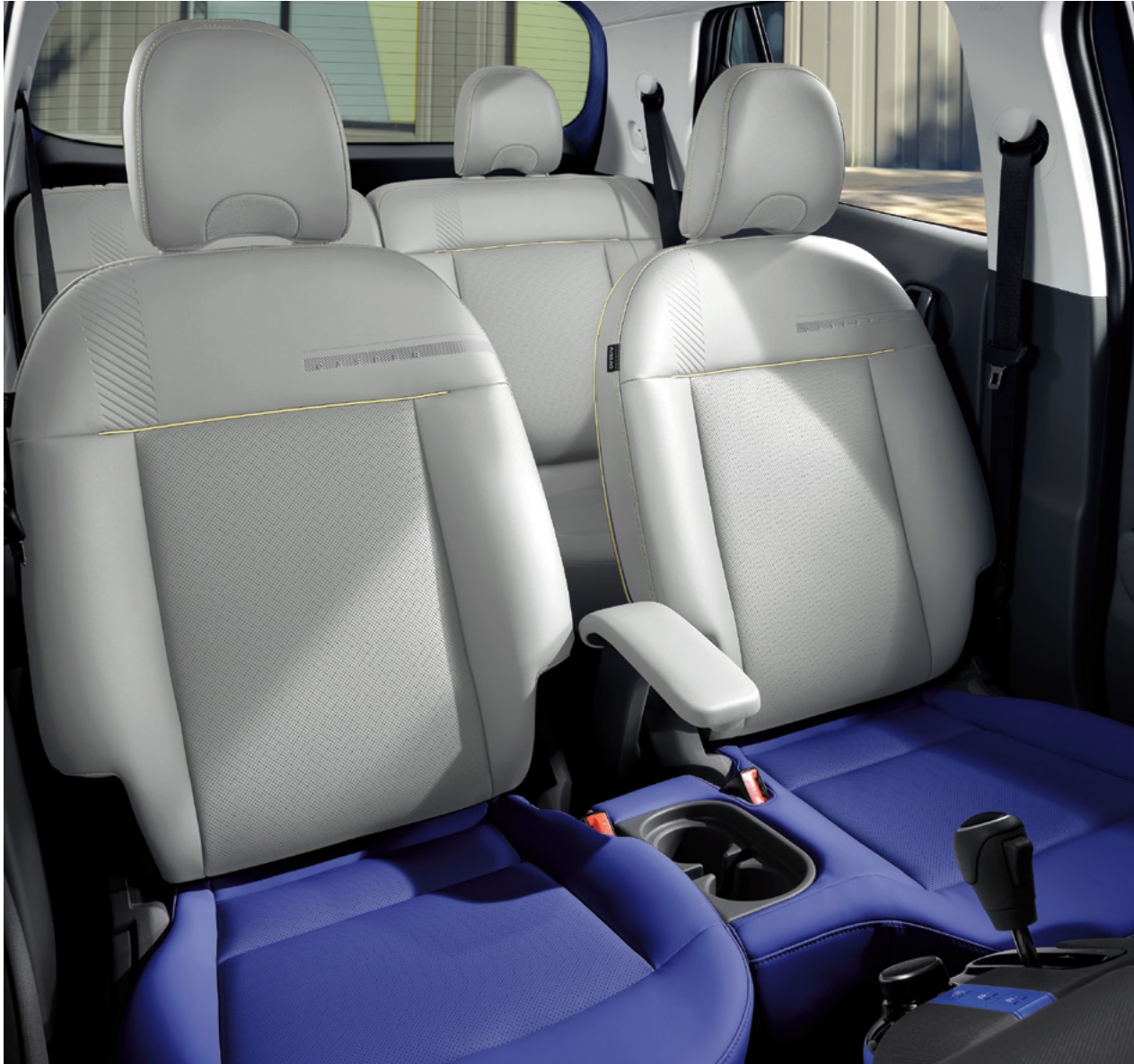
인스퍼레이션 풀옵션 : 라이트 그레이 / 블루 (레몬 포인트) 내장