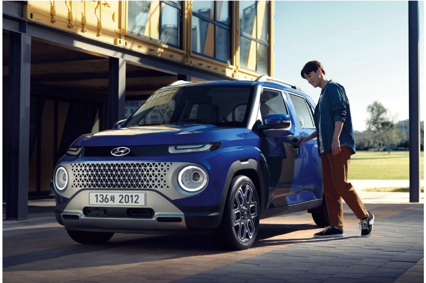
인스퍼레이션 : 인텐스 블루 펄 외장 (캐스퍼 액티브 / 액티브 플러스 옵션 미적용)