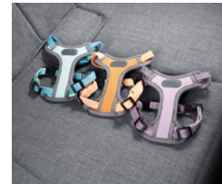
H Genuine 하네스 II (일상생활용, 소형/중형)