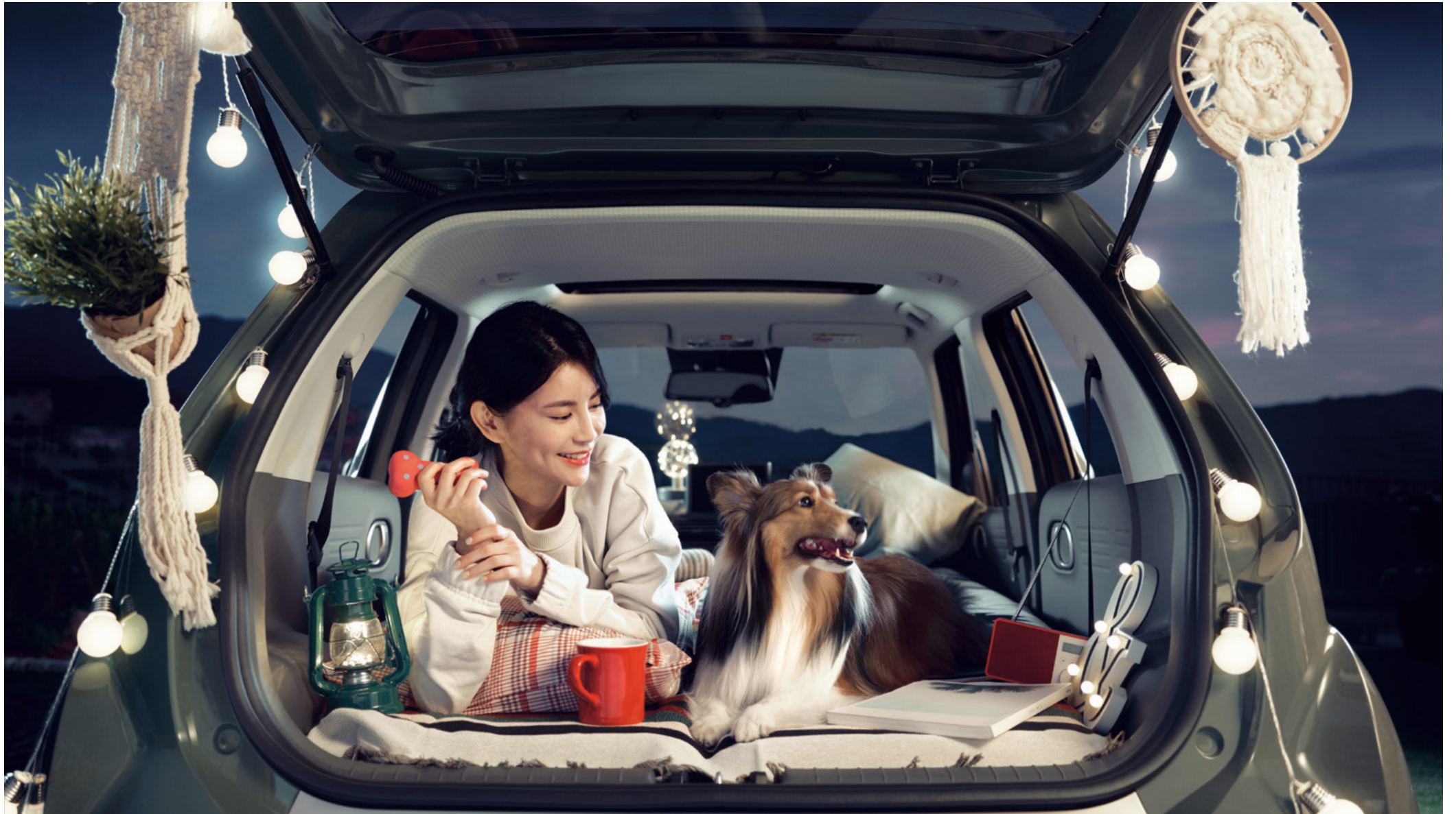
풀 폴딩 시트 (전자석)