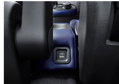
USB 충전기 (2열 1개)