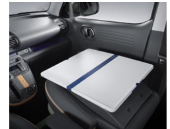
등승석 시트백 보드 테이블