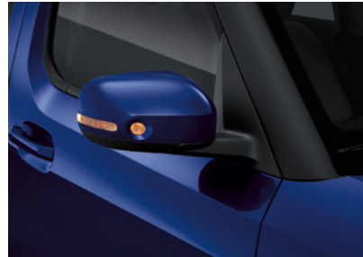
아웃사이드 미러 (LED 방향지시등)