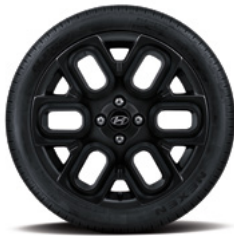
17인치 알로이 휠 & 타이어