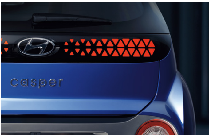
파라메트릭 패턴 LED 리어콤비램프