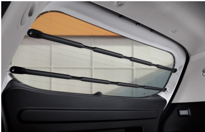
테일게이트 윈도우 보호봉