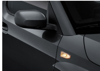
바디컬러 아웃사이드 미러 (열선, 전동접이, 전동조정, 락풀딩)