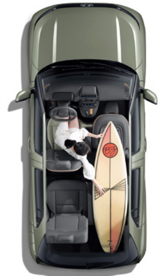
동승석 폴 폴딩 시트 / 2열 5:5 분할 폴딩