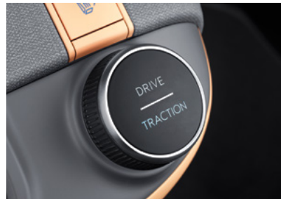
2WD 험로주행모드 (스노우/샌드/머드)