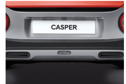
메탈페인트 스킵드 플레이트 (리어)