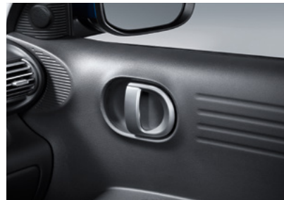
메탈페인트 인사이드 도어 핸들