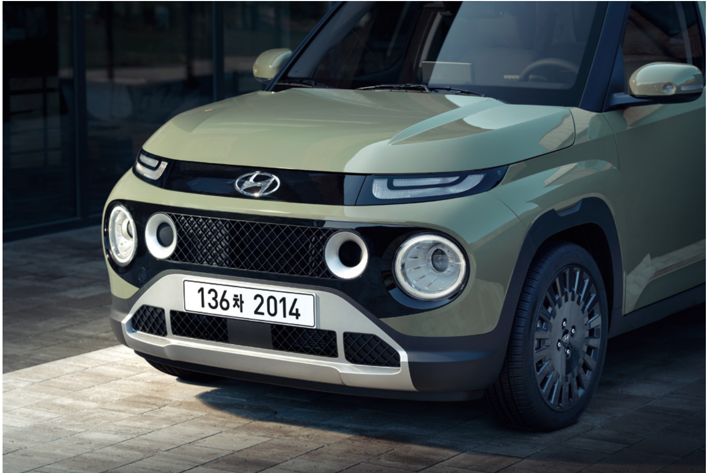
라디에이터 그릴 / 프론트 스킵드 플레이트 (캐스퍼 액티브 옵션 전용)