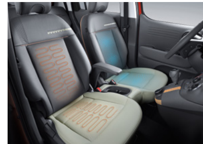
운전석 통풍시트 / 앞좌석 열선시트