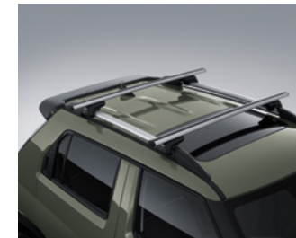
크로스 바 (사이드 어닝전용)