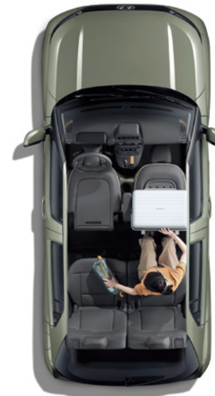
1열 폴 폴딩 시트