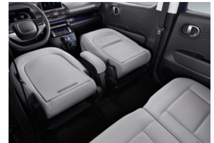
1열 풀 폴딩 시트