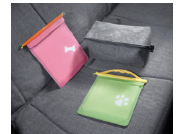
포터블 포켓 (먹이용/배변용) & 멀티 파워치