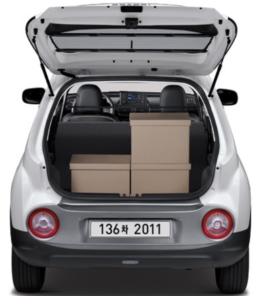
VAN 스마트 : 아틀라스 화이트 외장 (캐스퍼 액티브 옵션 미적용)

* VAN 모델은 스마트 트림만 출시됩니다. 자세한 사양 및 옵션은 해당 월의 가격표를 참고하시기 바랍니다.