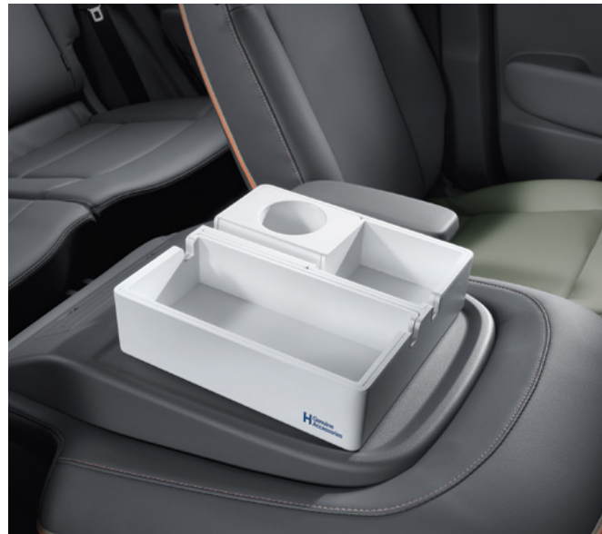
동승석 시트백 보드 트레이