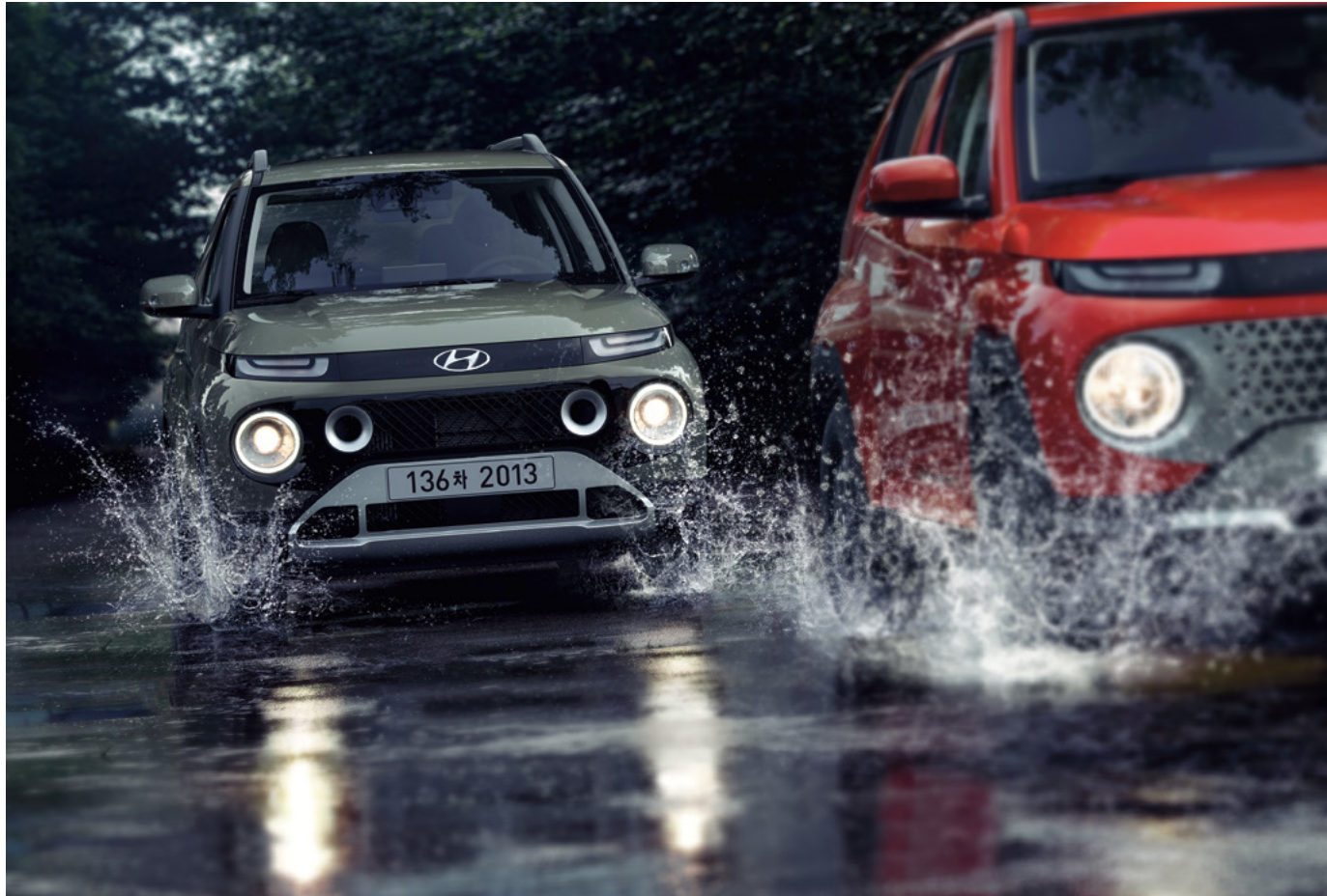
인스퍼레이션 : 톰보이 카키 외장 (액티브 플러스 옵션 미적용) / 모던 : 소울트로닉 오렌지 펠 외장 (캐스퍼 액티브 옵션 미적용)

캐스퍼 액티브 옵션을 통해 더욱 향상된 파워트레인 선택이 가능합니다. 주행 중 모드 변경을 통해 주행 환경을 최적화할 수 있습니다.