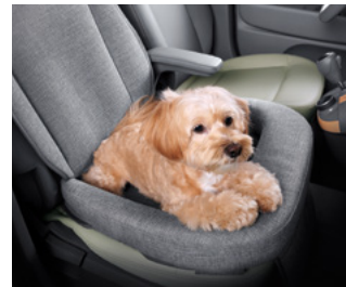
시트커버 쿠션 (1열)