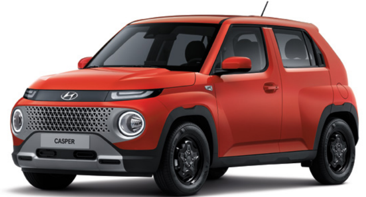
스마트 (티탄 그레이 메탈릭) / 모던 (소울트로닉 오렌지 펄)