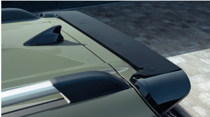
리어 스포일러 (액티브 플러스 옵션 전용)