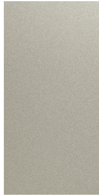
언블리치드 아이보리 (NES)