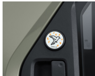
리어 도어 뱃지