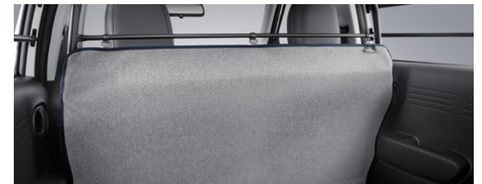
파티션 보드 방오 커버