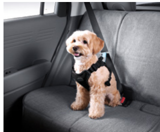
H Genuine 하네스 I (차량용, 소형/중형)