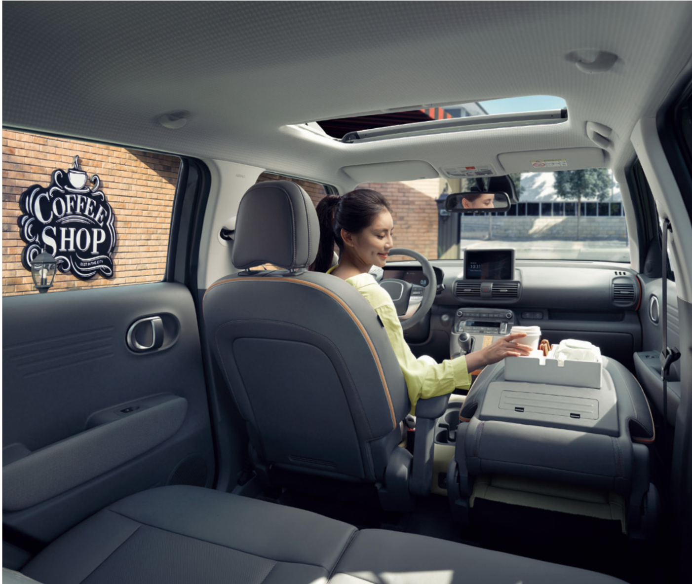
동승석 폴 폴딩 (시트백 보드*)

* 시트백 보드 트레이는 별도 구매 품목입니다. (H Genuine Accessories)