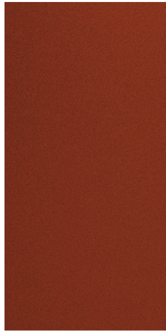
소울트로닉 오렌지 펄 (SOP)