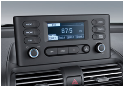
일반 오디오 시스템 (2/4스피커, USB, 블루투스 핸드프리)