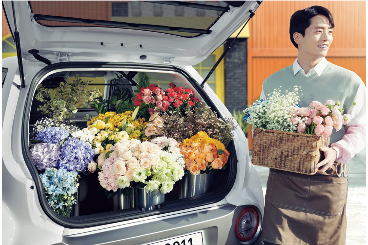
VAN 스마트 : 아틀라스 화이트 외장 (캐스퍼 액티브 옵션 미적용)

* VAN 모델은 스마트 트림만 출시됩니다. 자세한 사양 및 옵션은 해당 월의 가격표를 참고하시기 바랍니다.