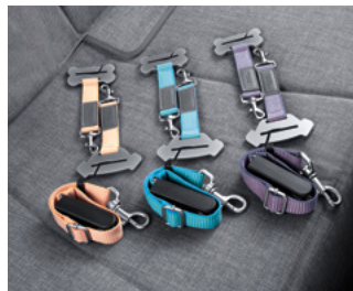
안전벨트 테더, ISOFIX 안전벨트