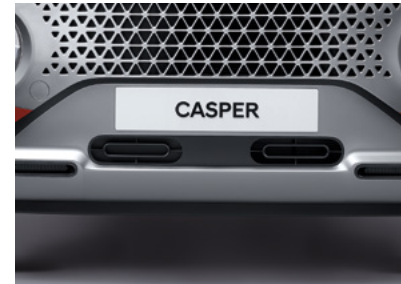
메탈페인트 스킵드 플레이트 (프론트)