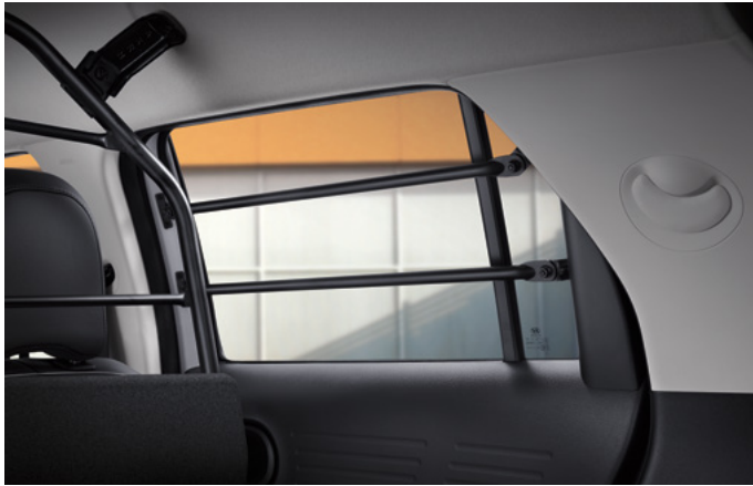
2열 윈도우 보호봉

업무에서 일상생활, 레저활동에 이르기까지 다재다능한 공간성을 제공합니다.