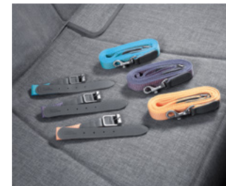
목줄, 리드줄 (소형/중형)