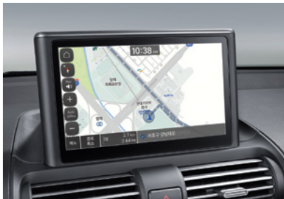
8인치 내비게이션 (6스피커, 블루링크, 폰 프로젝트, 현대 카페이)