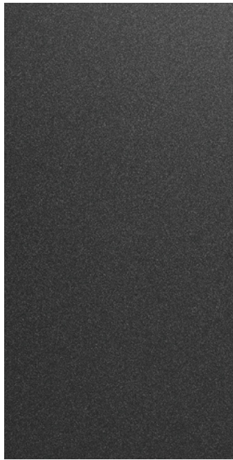
티탄 그레이 메탈릭 (R4G)