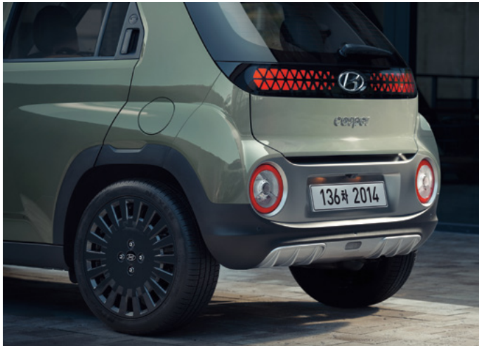
17인치 다크 그레이 알로이 휠 & 타이어 (액티브 플러스 옵션 전용)