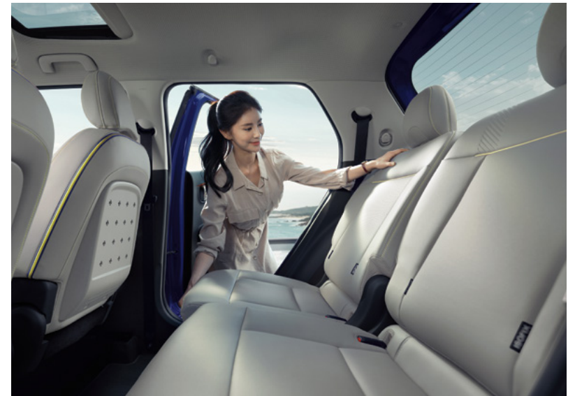
2열 슬라이딩 & 리클라이닝 시트