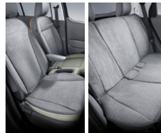
동승석 시트커버 (1열) / 방오시트커버 (2열)