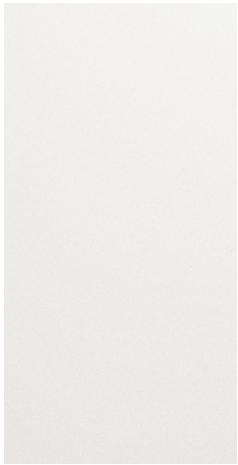
아틀라스 화이트 (SAW)