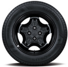
15인치 스타일드 스틸 휠 & 타이어