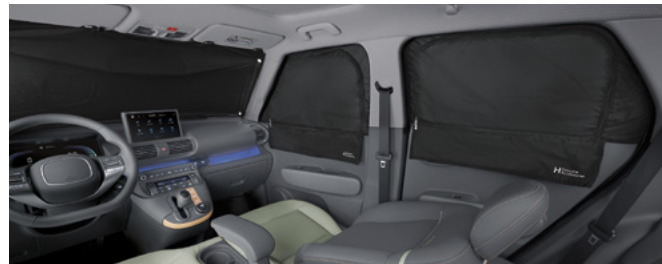
멀티 커튼 (전면/1열/2열)