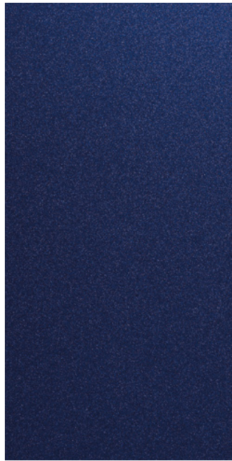
인텐스 블루 펄 (YP5)