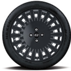
17인치 알로이 휠 (전면가공) & 타이어 17인치 다크 그레이 알로이 휠 & 타이어 (액티브 플러스 옵션 전용)