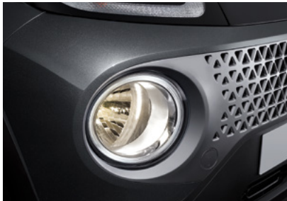
MFR 헤드램프 / LED 주간주행등