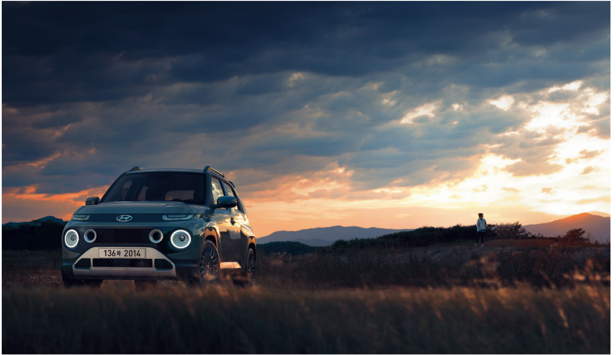
인스퍼레이션 풀옵션 : 톰보이 카키 외장