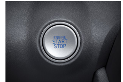
버튼시동 & 스마트키