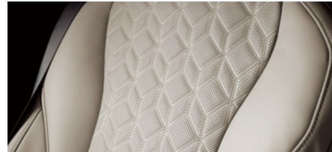
코튼 베이지 (퀵팅 나파가죽 - 4인승 후석 전용)