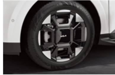
19인치 전면가공 휠