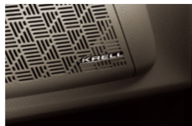
KRELL 프리미엄 사운드