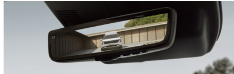
디지털 센터 미러