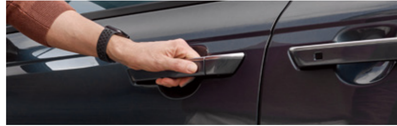
기아 디지털 키 2