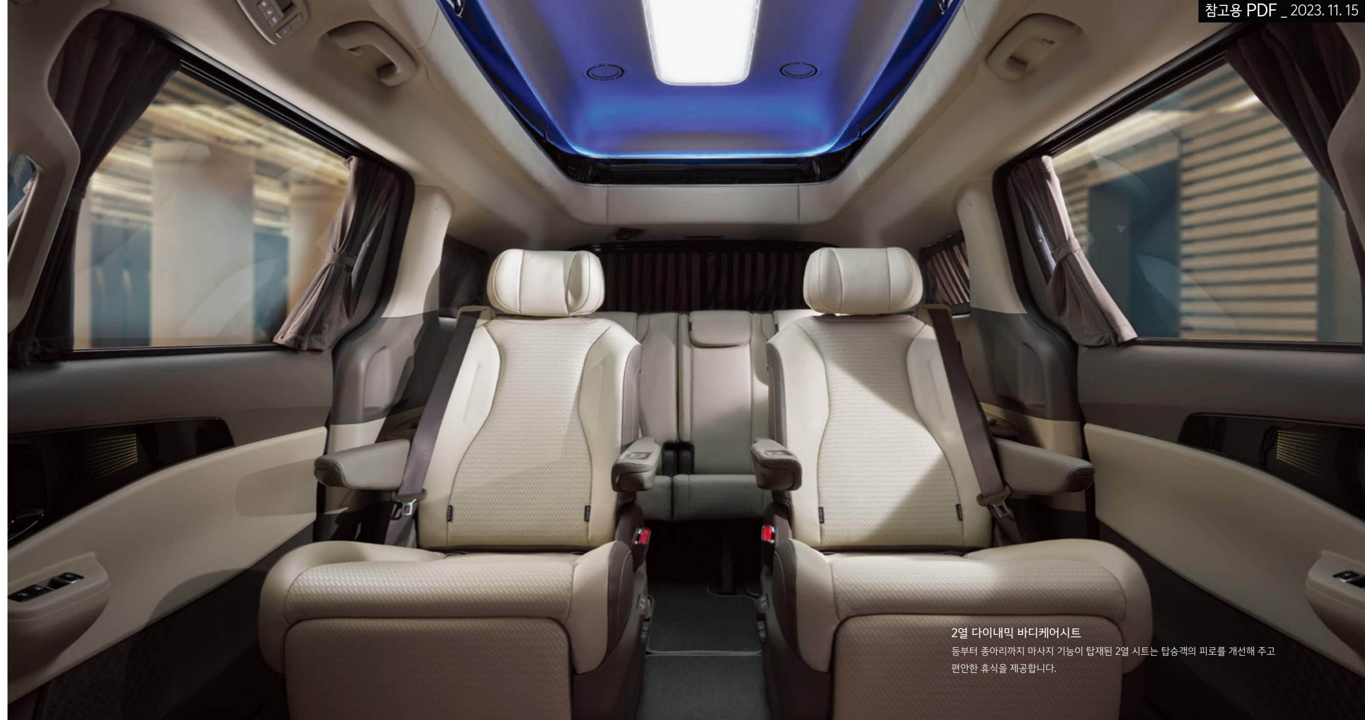
2열 다이내믹 바디케어시트 등부터 종아리까지 마사지 기능이 탑재된 2열 시트는 탑승객의 피로를 개선해 주고 편안한 휴식을 제공합니다.