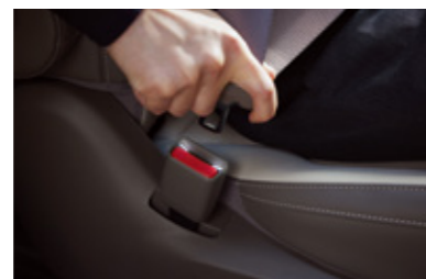
2열 시트벨트 버클 조명