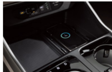
스마트폰 무선 충전시스템