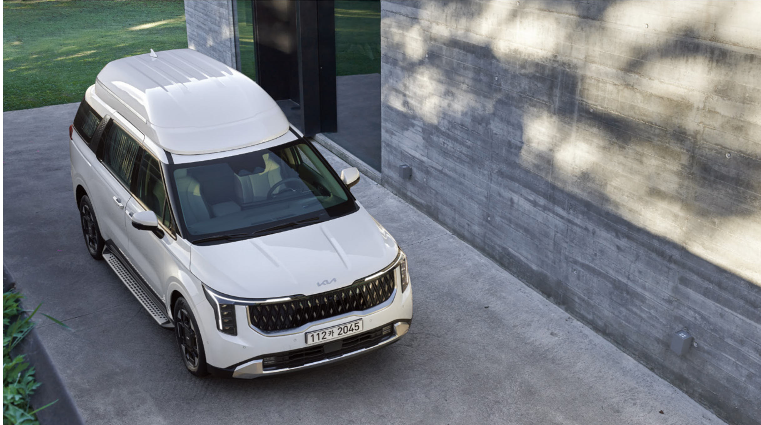
스노우 화이트 펄 (SWP) / 상기 사양구성은 7인승으로 촬영되었으며 트림, 인승 모델별, 엔진, 선택 사양에 따라 다르게 적용됩니다.