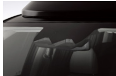
빌트인 캠 2