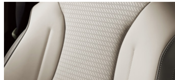
코튼 베이지 (나파가죽)