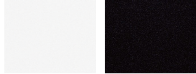
스노우 화이트 펄 (SWP)