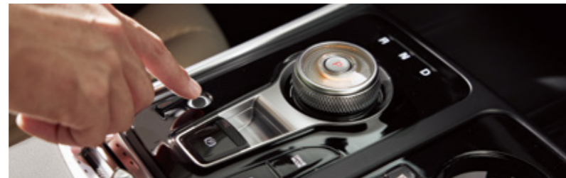
지문 인증 시스템